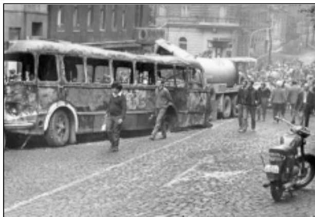
JEDNA Z TISÍCÍ FOTOGRAFIÍ ZE SRPNA 1968