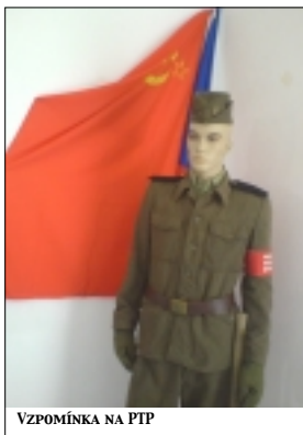
VZPOMÍNKA NA FTP

Zelená Hora se mimo jiné zapsala do českých dějin coby centrum odboje proti kališnickému králi Jiřímu z Poděbrad - právě zde revoltující katolíci páni ustavili Jednotu zelenohorskou. Zasněžení si ještě vzpomenu na zdejší nález tzv. Rukopisu zelenohorského, o jehož pravosti se prý, stejně jako v případě Rukopisu královédvorského, vede stále nejdelší literární bitva na světě. Alespoň místní expozice vás o tom bez uzardění přesvědčuje.