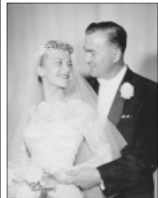
HISTORICKÁ FOTOGRAFIE Z ROKU 1958