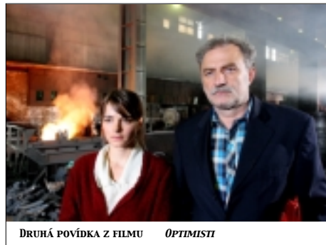
DRUHÁ POVÍDKA Z FILMU OPTIMISTI

Na festivalu je možné vidět řadu filmů, jejichž příběhy se odehrávají za polárním kruhem nebo v Mongolsku, komedii jako třeba holandsko-belgický film Číšník . Dále dokumentárních filmů, z nichž mne zaujal příběh z předměstí Káhiry Tyto dívky . Filosofickým filmem, který však sděloval něco více byl srbský snímek Optimisté . Režisér Goran Pakeljević se v pěti příbězích, v jakýchsi podobnostech, zabývá mocí a jejím zneužitím. V prvním příběhu policie svede všechny krádeže na hypnotizéra, který přijde do povodněmi zničené vesnice, aby vesničanům dodal sebevědomí. V druhém příběhu nově zbohatlý majitel oceláren znásilní dceru svého zaměstnance. Ten chystá pomstu, ale pak se raději násilníkovi omluví. Humorná je třetí povídka, kdy syn prohraje v kasinu peníze na otcův pohřeb a místo důstojného pohřbu je pouze rozptýl. Syn argumentuje tím, že takto uctil nejlépe otcovu památku. O krvežíznivém dítěti, kterého osvobodí naivní doktoři a které se pak chová jako řezník je čtvrtý příběh. Skutečně vyvrcholením celého filmu, který připomíná filmy režiséra Alexandara Petroviče, je