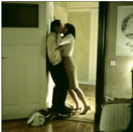
Z FILMU ŽIVOT DRUHÝCH

vyspí se socialistickým ministrem kultury. Začne pochybovat o své práci. V opelecké scéně přesvědčí herečky, aby se