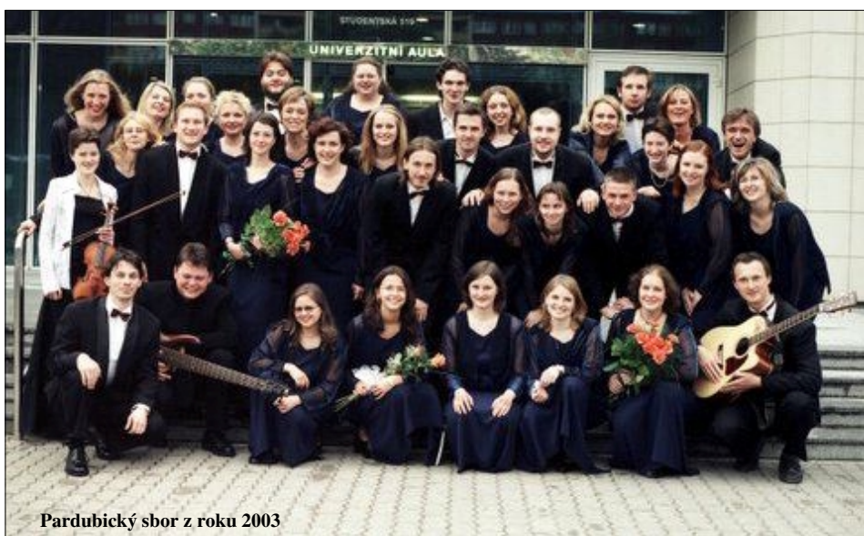
Pardubický sbor z roku 2003

Naši pěvci již od chvíle, kdy 1. července nastoupí v Praze do letadla, prožijí až do 17. července, kdy odlétají zpět do Prahy, doslova koncertový a turistický maratón. První dny pobytu v Kanadě se o ně postará montrealská Beseda, České a slovenské kulturní a folklorní centrum v Kanadě, jejíž členové zavítají s hosty také do hlavního města Kanady.