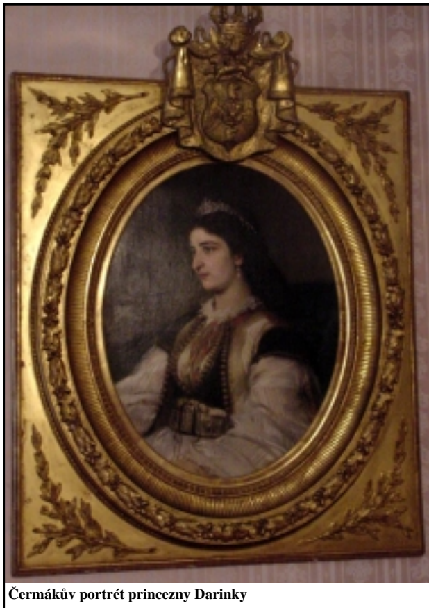
Čermákův portrét princezny Darinky

Paní Milena opravovala před domem nábytek. Poblíž byl starodávny kostel, zedníci, kteří ho opravovali a hřbitov. Kromě ikon, které jsou zde v každém kostele a dají se někdy spíše tušit než vidět nás zaujala stará zaprášená rakev u zdi. Jak jsme se později dověděli, nejednalo se o zapomenutého nebožtíka, ale o recyklovanou rakev na více použití. Když umřel někdo chudší, dali ho do této rakve. Po pohřbu dali nebožtíka do hrobu a rakev ponechali v kostele pro dalšího nemajetného nebožtíka.