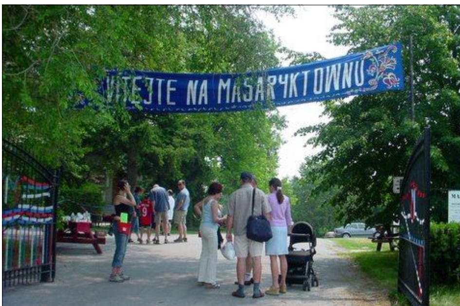
Letoší Český s Slovenský den na Masaryktownu

Přes den sedmatřicet, s vlhkostí relativní teplota činila jedenačtyřicet. Vzduch se téměř nepohnul. Nebylo rozdílu mezi teplotou uvnitř budovy anebo mimo ni. Vybrat si nebylo z čeho. Malounko se ulevilo jedině ve stínu. Tam alespoň nemohlo slunce. Když to vypadalo už už že bude pršet, lidi ani nereptali. Byla by to úleva, po které toužil každý. Dostalo se jí těm, co se smočili v umývadlech sociálních zařízení v areálu. Odpoledne se pak jako máchnutím kouzelného proutku vlhkost rozpustila a tak přišla i citelná změna. Konečně začal být rozdíl mezi tím, zda zůstat uvnitř budovy objektu anebo venku. Venku to začínalo být mnohem snesitelnější. A to byl také - podle většiny přítomných včetně organizátorů Československého dne, v pořadí již sedmapadesátého - důvod k lehkému poklesu počtu návštěvníků. Letos jich bylo snad o něco méně, ale i tak mělo těch několik stovek příjemný den i večer. Mohu tak soudit z faktu, že se mnohým ani nechtělo domů. Posedávali po trávníku až do setmění. Po celý den se nechávali unášet programem, v němž se vystřídaly snad všechny zábavní žánry: tanec, zpěv, přednes.