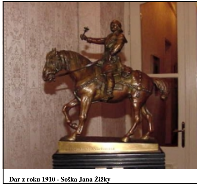
Dar z roku 1910 - Soška Jana Žižky