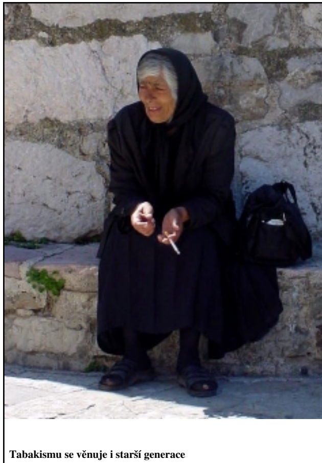
Tabakismu se věnuje i starší generace

Z České republiky se k Jaderskému moři dostanete nejlépe s turistickou kanceláří Vítkovice Tour . Obzvláště zájezdy na poslední chvíli jsou velmi populární a levné