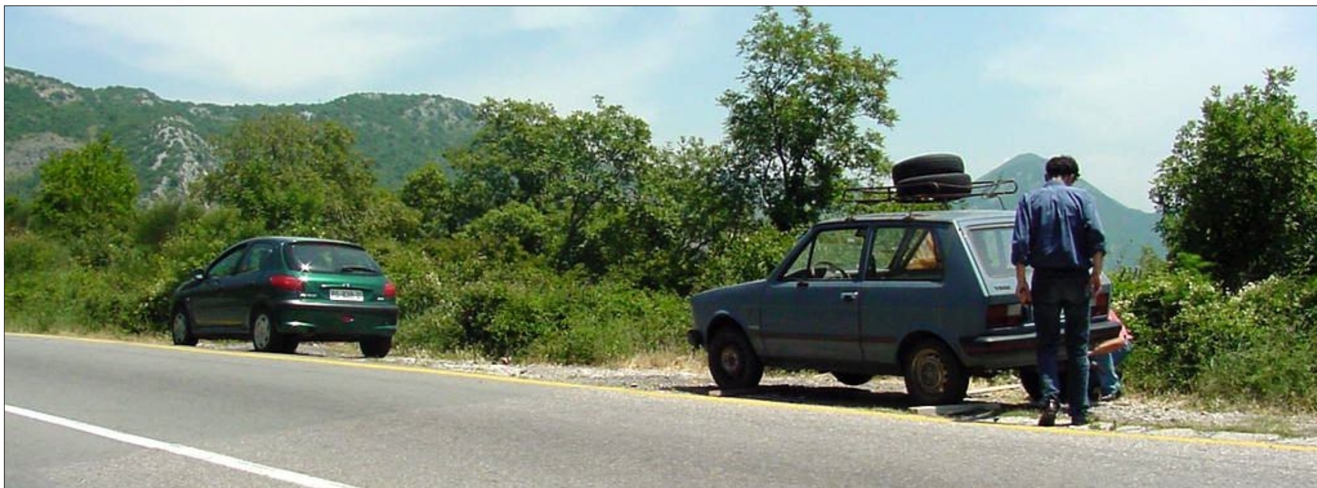
Zásoba pneumatik byla dostatečná, ale nafouknout se podařilo pouze jednu

V osmdesátých letech se promítal v Torontu film Dušana Makavejeva s poetickým názvem Monte Negro. Obyvatelé samotné Černé Hory, chcete-li Crne Gory, kteří tento film viděli však tvrdí, že se nejedná o někoho z nich, nýbrž o Srba z okolí Kragujevace. Už tato obrana napovídá, že film skutečně vystihuje něco z jejich života. Odehrává se ve Švédsku, kam přijede ušmudlané děvče z hor na jihovýchodě země. Již na letišti nás čeká první překvapení. Toto nevinné stvoření pašuje šestnáct litrů rakije a člověk jen s nevýslovnou bolestí sleduje, jak tento poklad odtéká v detailním záběru odpadem umyvadla na letišti. Předem vás mohu ujistit, že s takovýmto barbarstvím se v Černé Hoře dnes nesetkáte. I pravoslavný mnich Pavle, kterého jsme potkali na úpatí hor nad Petrovacem se před napitím tohoto lahodného nápoje pokřížoval.