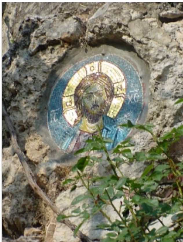
Ikonu lze spatřit i ve skále poblíž kláštera

Metamorfóza ušmudlané Černohorky se však přiletem nekončí. Již cestou z letiště potká své krajany, z nichž jeden má zapíchnutý nůž v prostředku čela. Nastává okamžik pro skupinové foto, protože ani tato situace neznamená, že by se narušil rytmus života této skupiny.