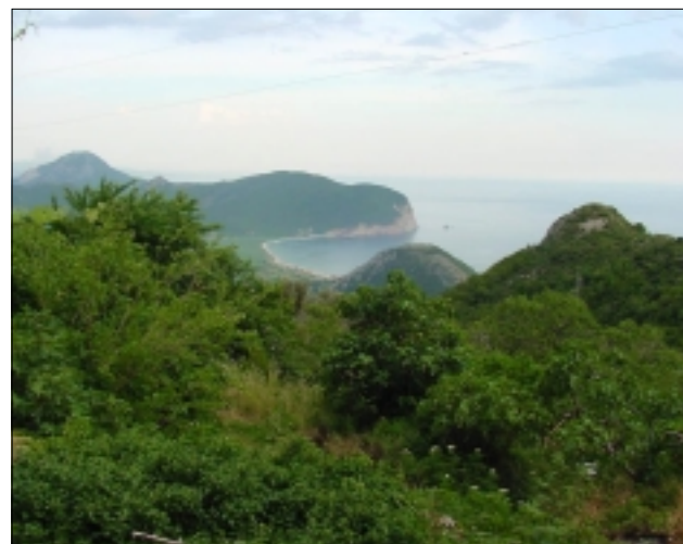
Pohled z Grabovice na záhlav v Petrovací