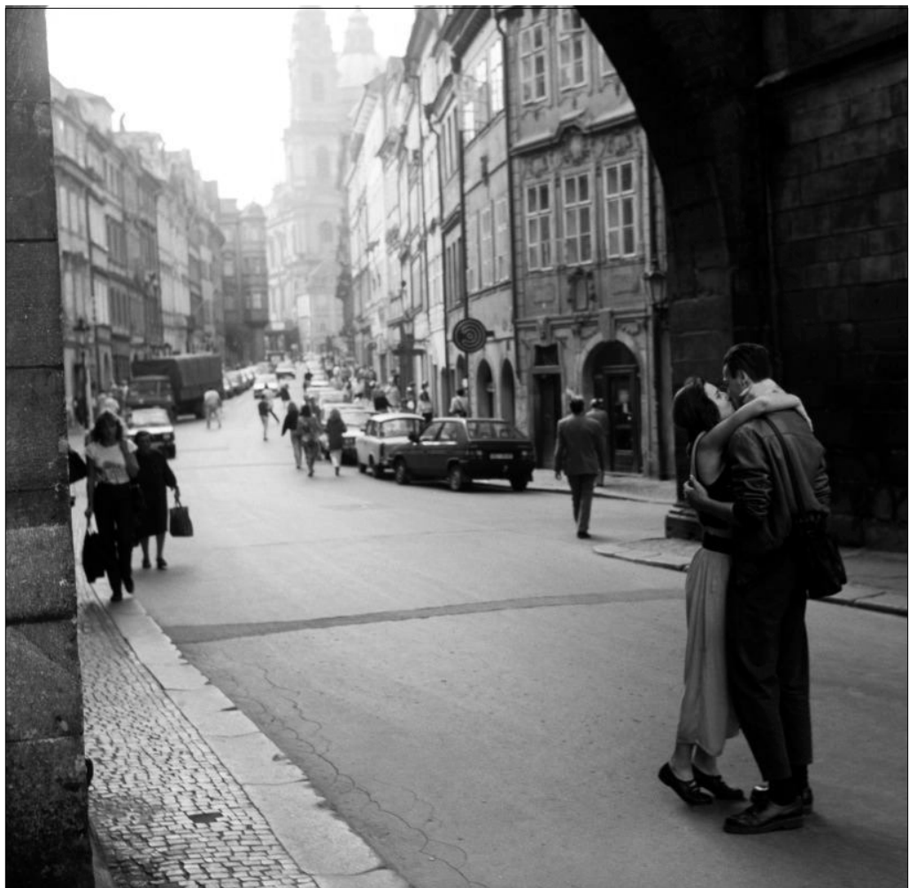
Yuri Dojč: Pražský polibek