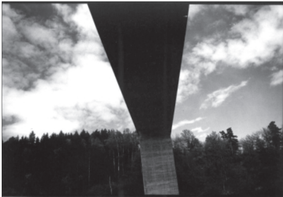
Nonstop - režie Jan Gogol ml.