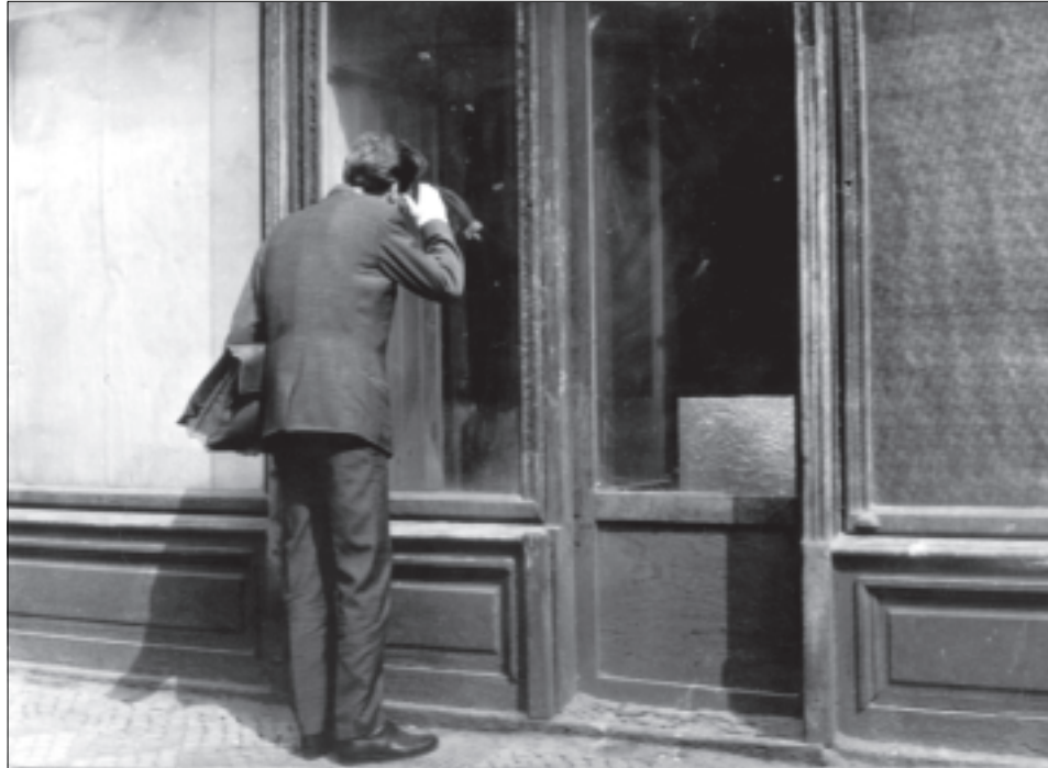
Z filmu Pavla Juráčka Postava k podpírání