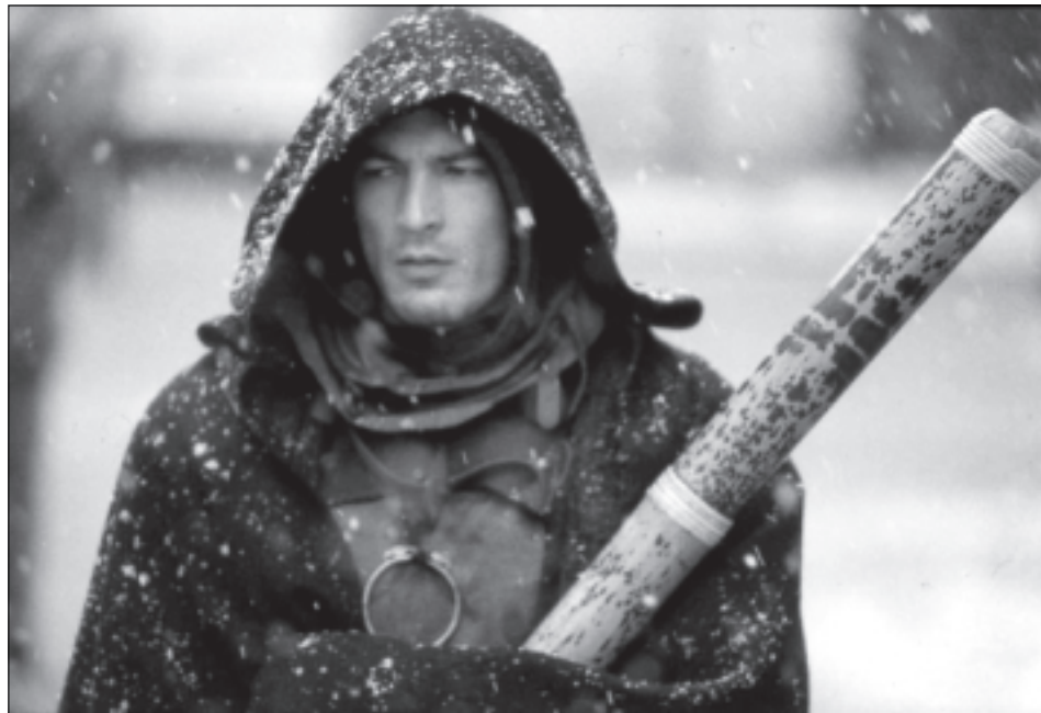
Petr Jakl ve filmu Krysař