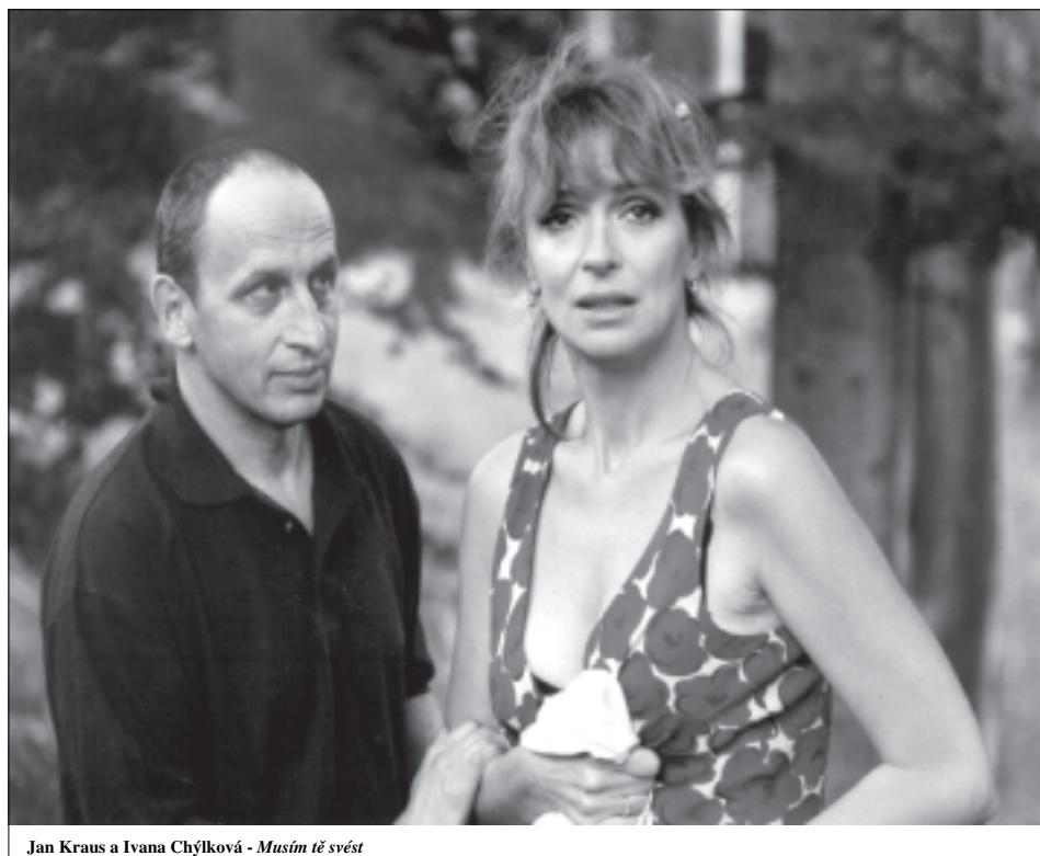
Jan Kraus a Ivana Chýlková - Musím tě svést