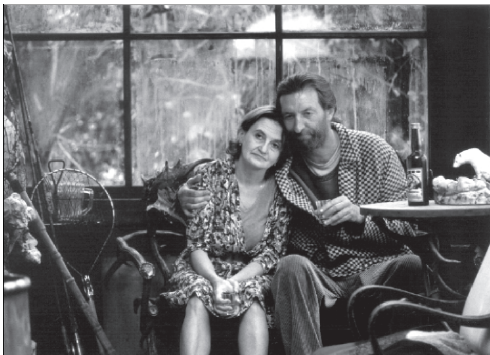
Bolek Polívka a Eva Holubová ve filmu Pupendo