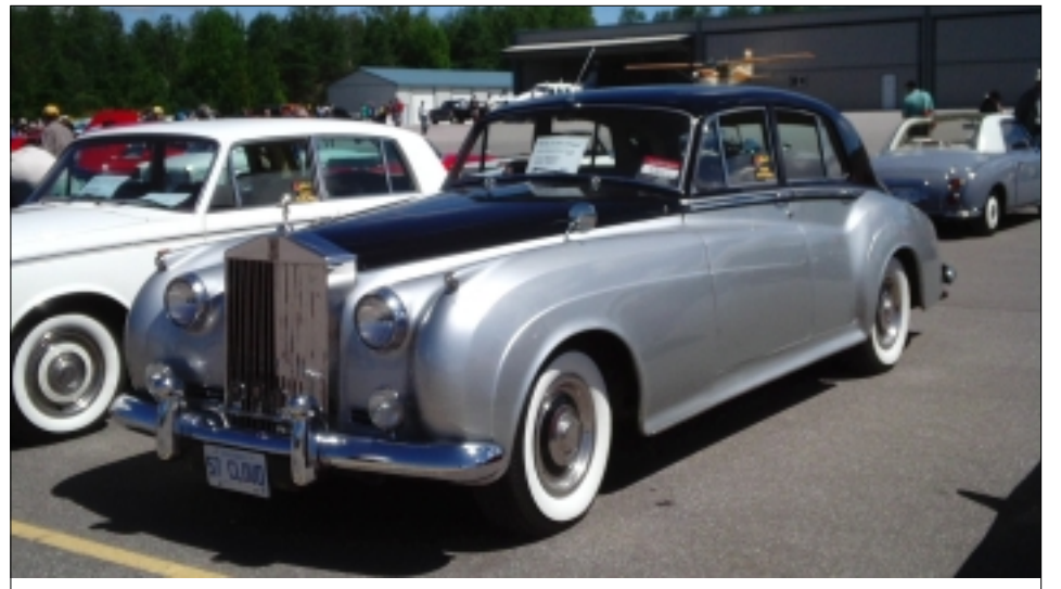
ROLLS ROYCE Z ROKU 1957

Československo, jakého jsem byl svědkem.