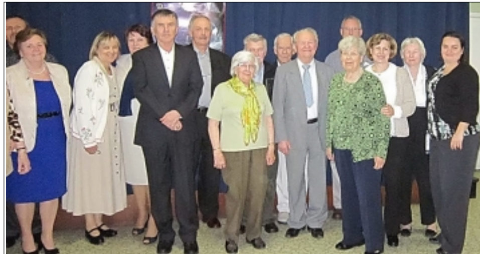
POLSKÝ EVANGELICKÝ SBOR SV. JANA, KTERÝ SE SCHÁZÍ V SLOVENSKÉM EVANGELICKÉM KOSTELE SV. PAVLA V TORONTU