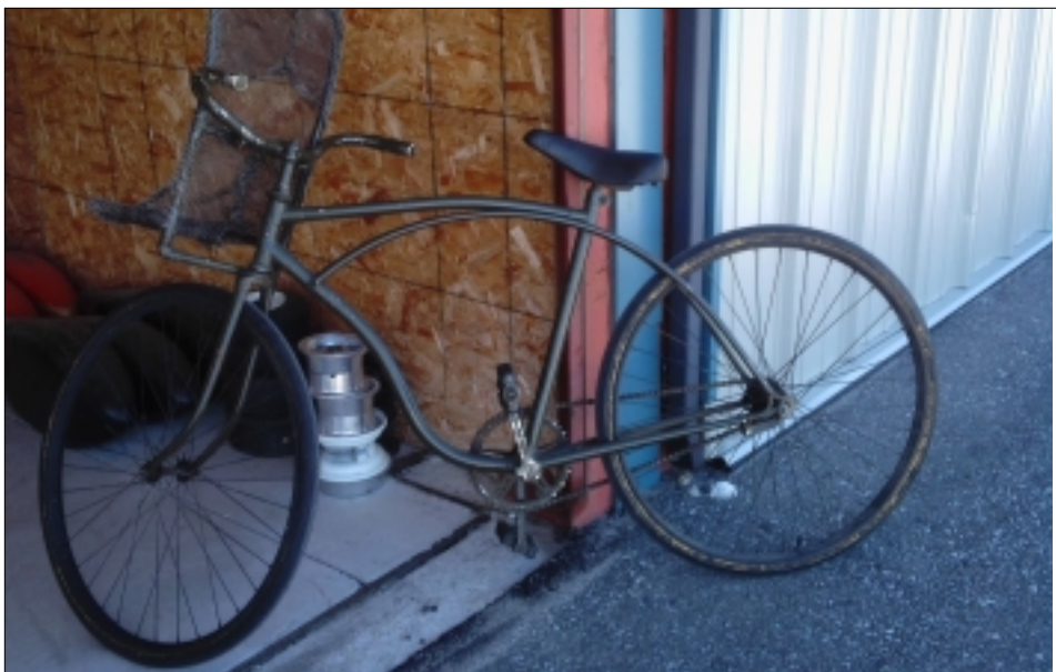
A TOHLE BYL PRO ZMĚNU HISTORICKÝ BICYKL