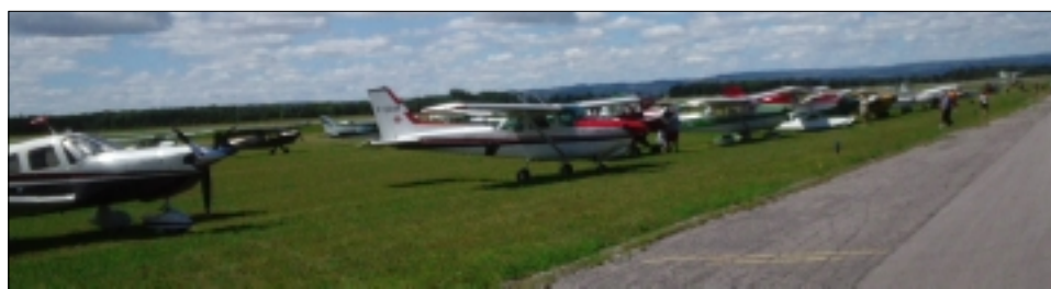
V EDENVALE BYLO 300 LETADEL