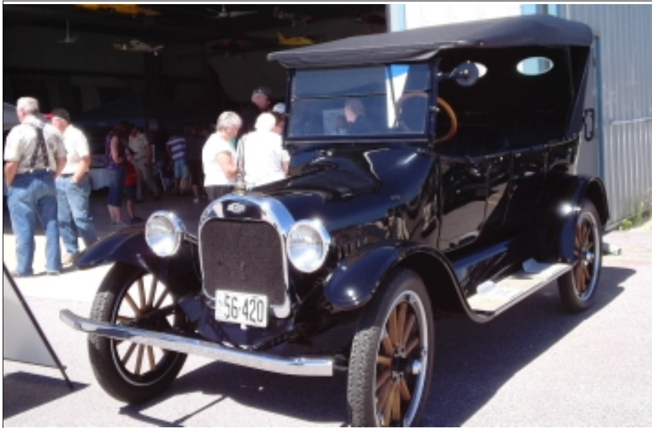
TENTO STROJ POCHÁZÍ PRAVDĚPODOBĚ Z ROKU 1915

vyfasoval sluchátka a čepici a už jsme vyrazili do hangáru a vytlačili jsme letadlo mezi přítomný dav. Po nutné kontrole vrtule a oleje, jsem se k svému překvapení posadil nalevo od pilota. U některých budíků na palubní desce jsem se dovtipil i k