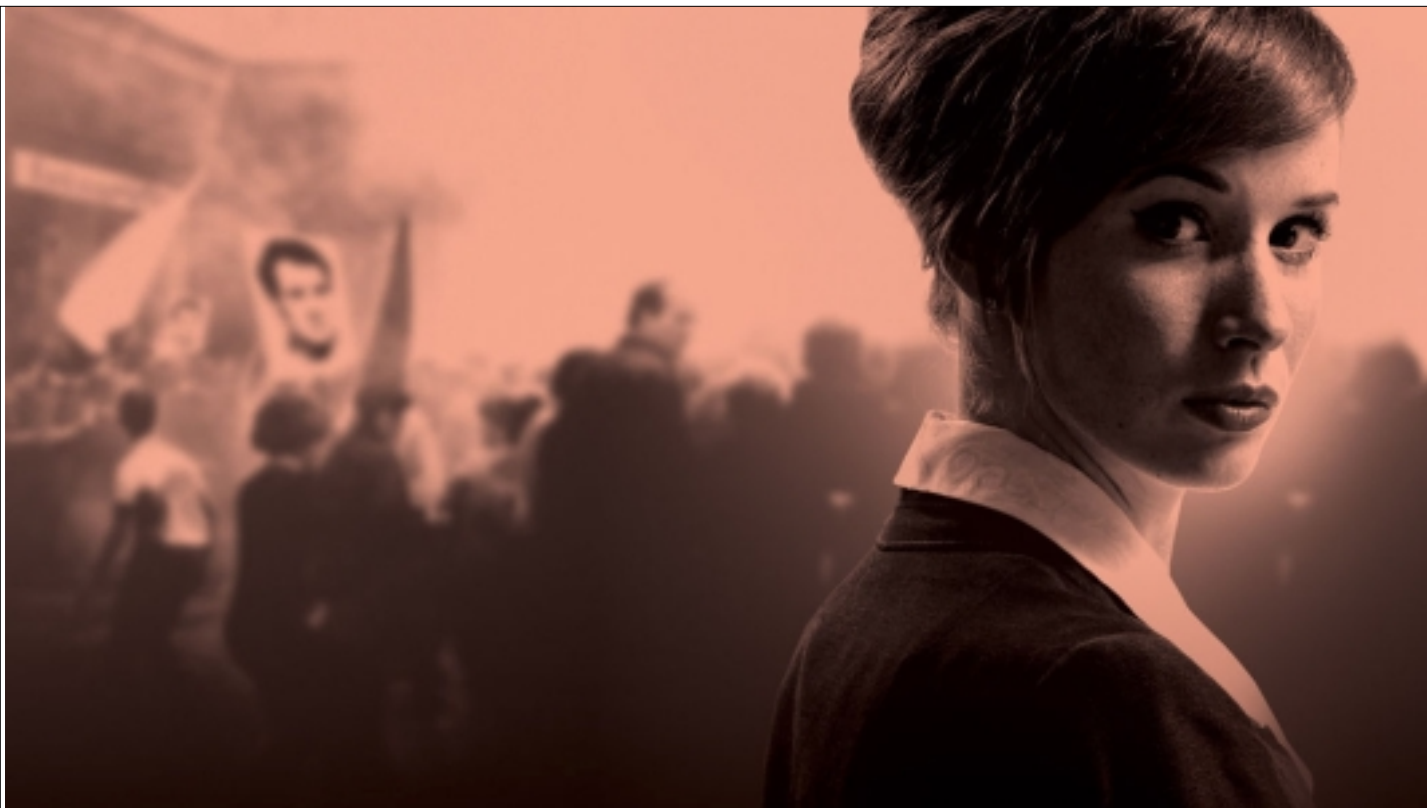
TATIANA PAUHOFOVÁ V TRILOGII HOŘÍCÍ KEŘ

Když jsem se dověděl, že známá polská režisérka Agnieszka Holland bude točit film o Janu Palachovi, byl jsem na rozpacích. Viděl jsem několik jejich skvělých filmů na předchozích Torontských festivalech, ale celkem jsem nevěděl nic o jejím životě.