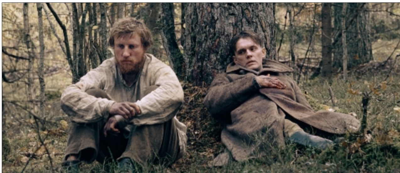
Z FILMU: V MLZE

Bylo to v neděli těsně před půlnocí, když skončil v promítací síni AGO v Jackman Hall poslední film letošního Mezinárodního filmového festivalu v Torontu. Jelikož se jednalo o vynikající film V mlze běloruského režiséra Sergeje Loznicy, který vyrůstal v Kyjevě, kde vystudoval matematiku, a žije v současné době v Berlíně, dá se říci konec dobrý, všechno dobré. To by mohlo tak nějak platit o festivalu, nikoliv o tomto filmu, který byl dobrý, ale konec ve filmu nebyl v žádném případě happy-end.