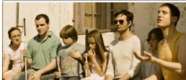
POLSKÝ FILM IMAGINE

Ke špičkám východoevropské kinematografie patřil film polského režiséra Andrzeje Jakimowského natočený v klášteře v Lisabonu. Ve filmu hrají až na výjimky pouze slepí herci z celého světa. Dramatický příběh nového učitele, který chce děti naučit, aby se dokázali pohybovat v prostoru bez slepecké hole. Jeho metoda, založená na ostatních smyslech: sluchu, čichu a hmatu, má dodat slepým dětem sebedůvěru.