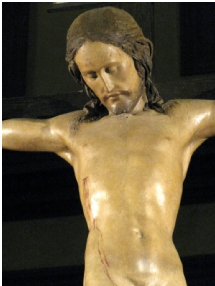
ZRESTAUROVANÝ MICHELANGELŮV KRISTUS SE VRÁTIL DO FLORENCIE

Když jsem přijel domů do Prahy, tak právník, který tehdy ještě nebyl prezidentem, zavřel hranice a bylo po vtákách. O pár let později se stal prezidentem a mně oznámili, že jsem se zdržoval v Československu pouze dočasně a tak jsem se octnul za mořem. Od té doby jsem viděl nejvíc Italů, když Itálie porazila Německo 3:1 ve finále MS ve Španělsku. To bylo na křižovatce St. Clair a Dufferin.