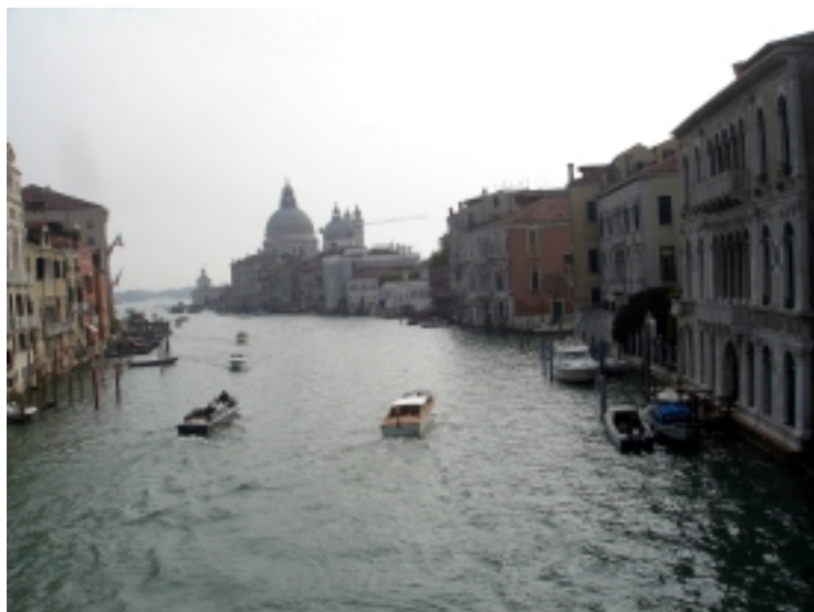
POHLED NA BENÁTKY Z DŘEVĚNÉHO MOSTU