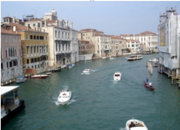
A JEŠTĚ JEDEN POHLED NA BENÁTKY

Alaš Březina, Florencie, Benátky, Praha