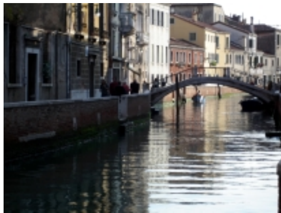
JEDEN Z MNOHA BENÁTSKÝCH MOSTŮ

Při páté cestě v roce 2003 mi pro změnu bankomat hned po příjezdu sežral kreditní kartu a v Palermu mně ukradli foťák. Letos to byl tedy můj šestý pokus a musím říci, že téměř bez problémů. I když i tentokrát se nějaká ta chybička vloudila. Moje žena, která se celý srpen svědomitě připravovala na cestu do Itálie a zjišťovala, nezjistitelné - kolik ji bankomat vydá najednou peněz. Rozporuplné odpovědi přicházely, protože každý automat vydá jinou sumu. A moje žena v okamžiku odchodu z domu na letiště zjistila, že tuto kreditní či debitní kartu nemá. Nastalo zoufalé hledání obrácení šuplat, až v jednom z nich byla nerozlepená obálka. To už jsme měli asi dvacetiminutové zpoždění. Jenže to zároveň znamenalo, že