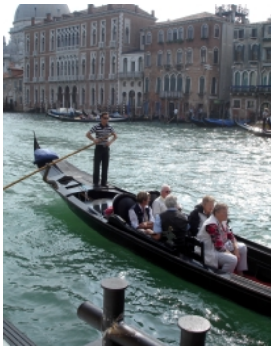
PRUHOVÁNÍ GONDOLÁNI JSOU SYMBOLEM BENÁTEK

Až v roce 1996 se Slavia prokousala až do čtvrtfinále Poháru UEFA a narazila na slavný AS Řím. Z Prahy vyrazilo několik autobusů. A tak se mi podařilo vyrazit do věčného města. Zájezd sliboval jeden den v Římě. Jenže neukáznění fanoušci