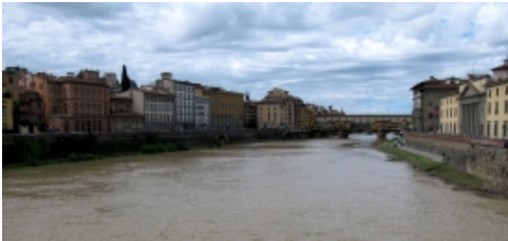
PONTE VECCHIO VE FLORENCII

nepřetržitě celé hodiny žvaní. Většinou začnou větou, kterou znám z dětství: „Dove sei tu?“ Ke všemu štěbetají italsky a před tím není úniku. Jakmile jedna padne únavou, okamžitě začne další. Takto si předávají štafetu až do západu slunka. Po západu slunce se rozsvítí světla televizních obrazovek a všichni čumí na Berlusconiho stupidní show a mezitím turisté pozorují velikány italských dějin, procházejí se po Ponte Vecchio. Sledují sochy Michelagela, obrazy Boticelliho, výstavu, která nese hrdé jméno Caravaggia, ačkoliv je tam kromě jeho legendární medúzy pouze jeden jeho obraz. Přesto je to skvělý zážitek, být po dvanácti letech opět v tomto městě. Co víc si člověk může přát?