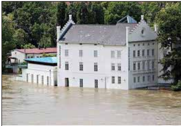
Zatopené muzeum Kampa - 2013.