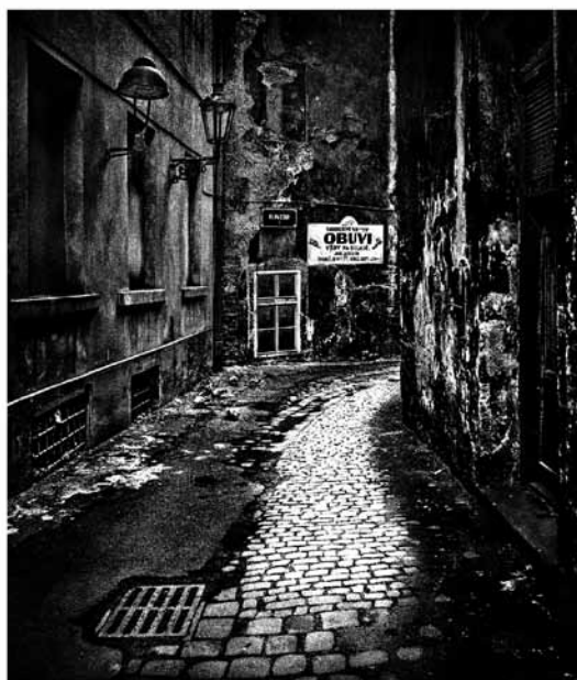
Shea Store, 1976