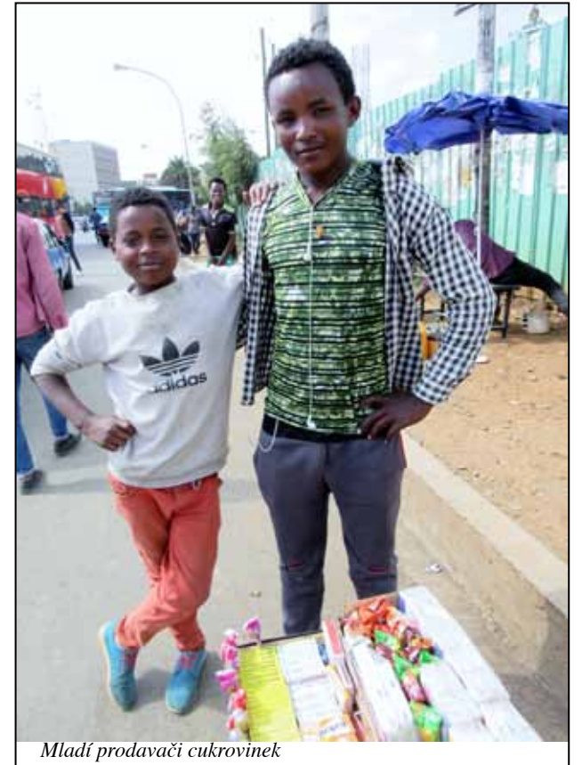
Mladí prodáváči cukrovinek

jednoho z průvodců , mi byl hned doporučen a k dispozici, cena domluvena a očekávala jsem adrenalinovou jízdu, která hned taky začala! Rozjžděli jsme se postrkem auta, do kopečků to řidič ani nezkoušel, to jsme jeli oklikou, převodovka nepřehazovala, stále druhá rychlost, už jsem byla připravena jít zbytek cesty pěšky, ale... dojeli jsme! Ocenila jsem, jak si řidič s autem - skoro vrakem – dovedl poradit a suverénně si počínal. Při výstupu mi ale musel otevřít dveře, měla jsem totiž pocit, že sama bych asi drátem zavřená neotevřela. Drobné i něco navíc si dal s poděkováním a úsměvem hned do kapsy, třeba to byly