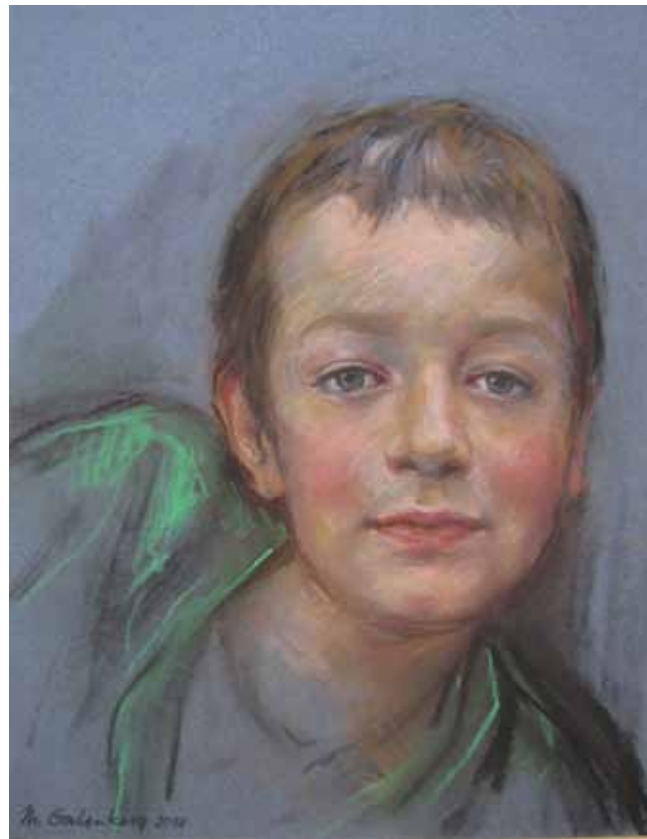
Matyáš - pastel 2018