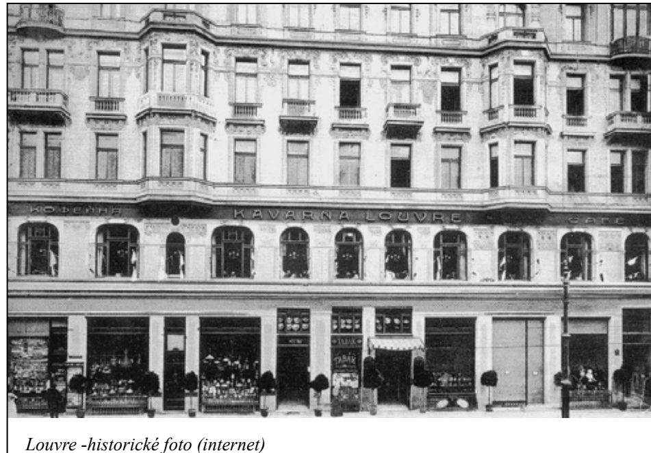
Louvre -historické foto (internet)

a našlo by se toho mnohem víc. Kavárna na sebe strhla, a právem, i pozornost světovou, v dokonalém domě s obrovskými okny a zrcadly, s nadčasovým vybavením – to vše jí dělalo bezchybnou reklamou ve světě.