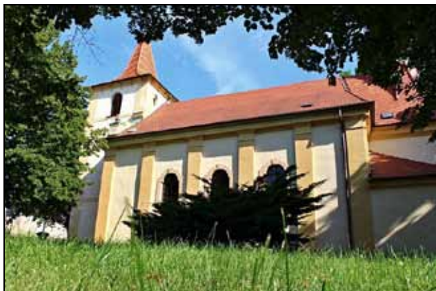
Stochov – Kostel svatého Václava

Stochov je malé město nacházející se mezi Kladnem a Novým Strašecím, dnes s asi 5500 obyvateli. Na svém náměstíčku s typicky venkovským vzhledem má staříčkův dub – vlastně už jen jeho jakési zbytky, neboť většinu z jeho větví už vzal čas. Přesto všichni ze Stochova vám řeknou, že ten dub tam zasadila sv. Ludmila, babička sv. Václava na počest jeho narození a tomu všichni pevně věří. Václav se narodil asi roku 903, ale uvádějí se i jiné roky jako 907 nebo 908. Stochovští tvrdě stojí za svým tvrzením, že sv. Václav spatřil světlo světa u nich na tehdejších dvorcích hradiště ve