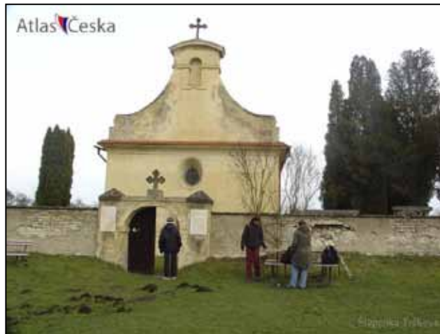
Kostel sv. Jiří, Libušín

Libušín . Další místo, které má v sobě stopy naší státnosti, zatím ne zcela dokladované. Všechny ze tří dcer vladky Kroků měly dle legend svá sídla, Kazi Kazín, Teta Tetín a věštkyň Libuše Libušín, který, jak jsem už uvedla, je zatím nejméně průkazný, ale jako pověst s příchutí pohádky si nemohu odpustit ho vypustit. Také zde bylo už v 9. století obrovské hradiště kolem 12 hektarů s čtyřmetrovými valy, z čehož se zbytky zachovaly a prošly archeologickým průzkumem. Dnes bezpečně víme, že ke stavbě zdi byla použita opuka – opukové lomy jsou v této krajině vlastně dodnes. V hradišti byla rotunda – dnes má Libušín na