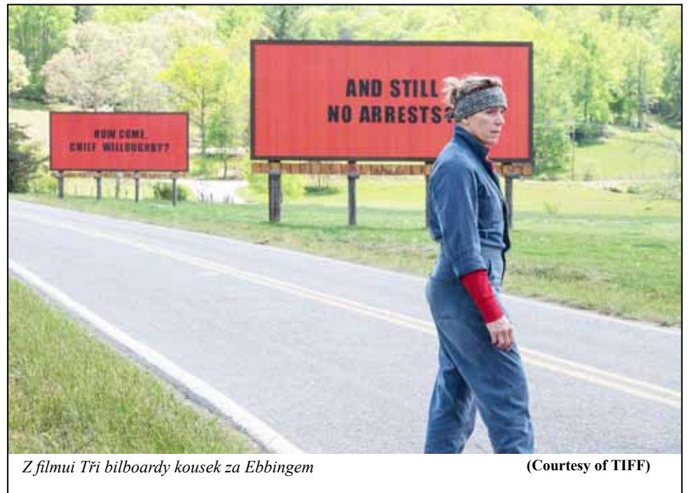
Z filmu Tři billboardy kousek za Ebbingem

Pochopitelně se tím shlédnutím oscarovských nominací na nejlepší film roku 2017 poněkud