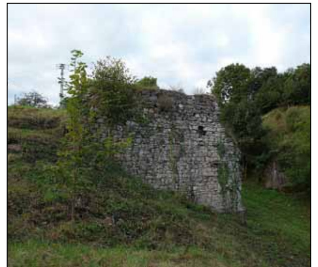
Výšinné opevněné sídliště - hradiště, archeologické stopy Tetín

vyučuje Václava. U pilířů po stranách oltáře je menza s kamenem symbolizující místo její zákeřné smrti uškrcením.