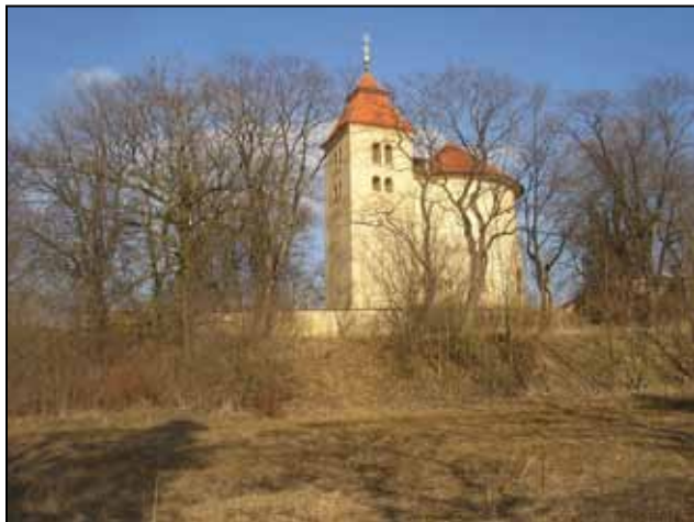
Budeč - Kostel svatého Petra a Pavla, před kterým je patrný val západní strany opevnění akropole

Budeč je dalším místem naší státnosti. Budeč se zbytky hradiště se nachází asi 17 km severovýchodně od Kladna. Zdejší kostel sv. Petra a Pavla z 11. století, postavený zřejmě na místě jakési původní rotundy je nejstarší stojící budovou v Čechách. Od roku 1958 je na seznamu kulturních památek. Z provedených archeologických výzkumů se ví, že se zde jednalo o mohutné hradiště s neméně mohutným opevněním, valy jsou dosud patrné. Hradiště mělo dva obvody s nejvyšším bodem terénu v prostoru tzv. akropole rozlohou asi 3 ha a právě na akropoli stála rotunda a později výše citovaný kostel. Rotundu nechal zbudovat zřejmě kníže Spytihněv, syn knížete Bořivoje, mezi roky 895 – 905. Kolem rotundy byl objeven i hřbitov. Dnes existují důkazy, že vrch akropole byl obýván už v pravěku – archeologický výzkum potvrdil nálezy z doby mohylové kultury střední doby bronzové a kulturu knovízskou z pozdní doby bronzové. První hradba je zdokumentována ve slovanském období asi z 9. století, takže za knížete Bořivoje a důkazy dnes existují i pro stavbu