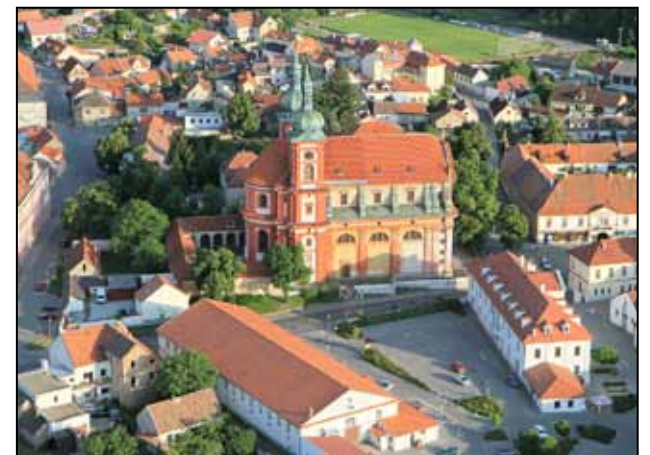
Stará Boleslav – letecký pohled

„Svatý Václave, vévodo České země, kníže náš, pros za nás Boha, svatého ducha, amen“. Tato slova Svatováclavského chorálu z 12. století jsou dokladem úcty k nejstaršímu českému světcovi a jednomu ze zemských patronů, sv. Václavovi. Více než tisíc let projevovaná úcta ukazuje, co pro náš národ v průběhu věků tento světec znamenal. Kanovník vyšehradský v souvislosti s bitvou u Chlumce ve 12. století, označil Čechy za čeleď sv. Václava a Václav je od tohoto pojetí chápán jako