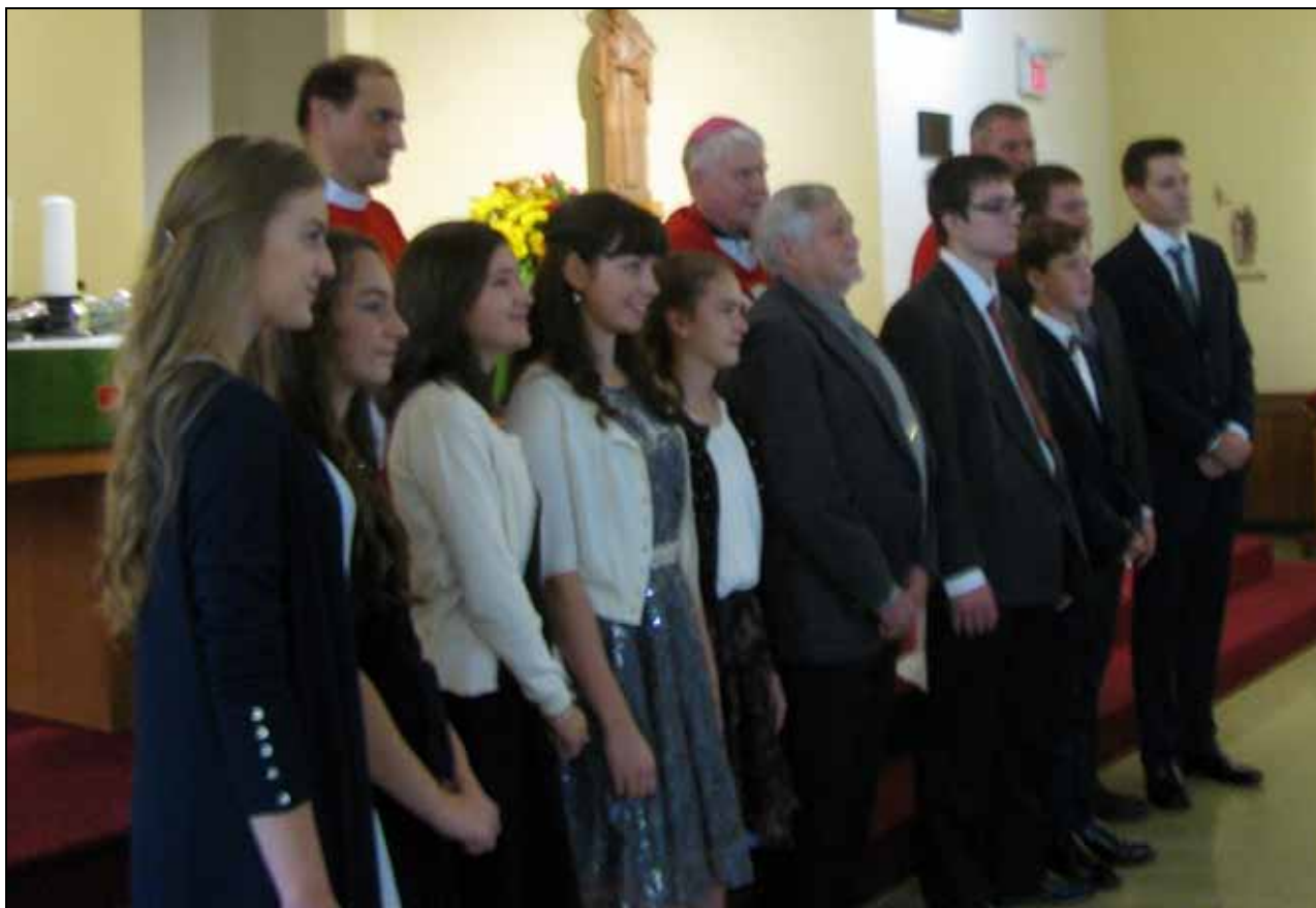
Slavnost biřmování v kostele sv. Václava

Biřmování (z latinského confirmatio utvrzení) je jedna ze sedmi svátostí katolické, pravoslavné, anglikánské církve a Církve československé husitské. Spolu se křtem a eucharistií je biřmování jednou z iniciačních svátostí, podle nauky zmiňovaných církví je to svátost ustanovená Ježíšem Kristem, jejíž prostřednictvím křesťan od Boha dostává pečeť daru Ducha Svatého. Spolu se křtem a svátostí svícení biřmování podle katolické nauky vtiskuje do nitra člověka nezrušitelné znamení, proto se tyto svátosti mohou přijmout jen jedenkrát za život. Letos 2. října se konala tato slavnost v kostele svatého Václava za účasti svátícího biskupa Václava Malého. Jelikož se slavnost konala v době svátku svatého Václava, bylo i kázání pronesené biskupem Václavem Malým věnováno tomuto světcí. Zároveň se farnost rozloučila s farářem Liborem Švorčíkem, který se bude hlavně věnovat krajanům mimo Toronto. Zde přinášíme podstatnou část kázání biskupa Václava Malého: Rád bych se vrátil ke čtení z knihy Moudrosti . Předchází moudrost ty kdo po ní touží ukazuje se jim první. Neunaví se, kdo k ní časně přichází, najde ji, jak mu sedí u dveří. (Mdr. 6, 12-16). Pak je zde řečeno, aby ten, kdo chce být moudrý toužil po Božích slovech.