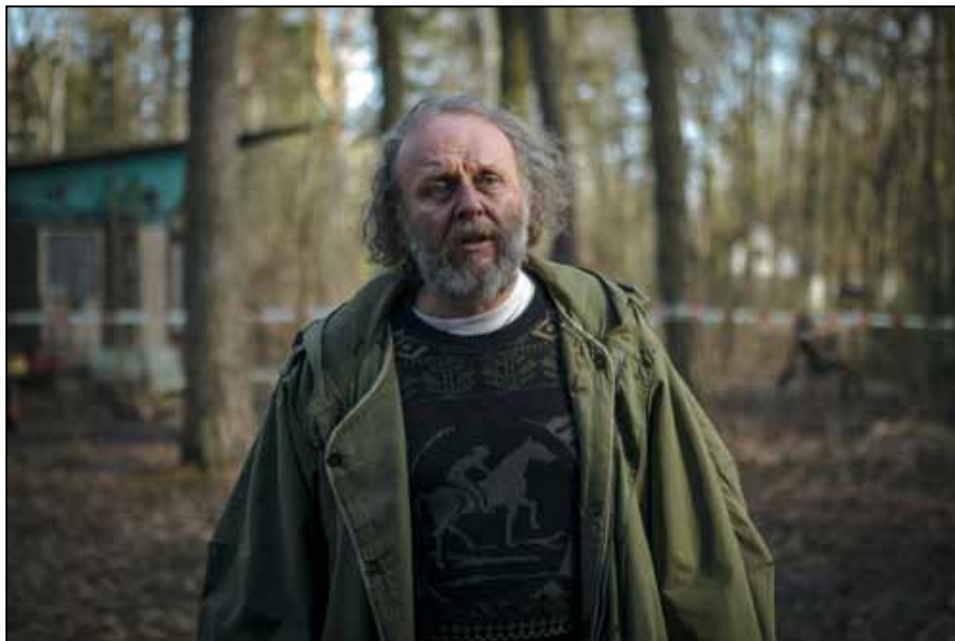
Jaroslav Dušek v seriálu Pustina

Film má tři roviny, jedna je spíše jako detektivní příběh, tragédie v zapomenuté obci, druhou rovinou je vliv těžářských společností na život obyvatel, třetí rovinou je rozpolcená osobnost jednoho z hlavních hrdinů. Jak se Vám jako scénáristovi dařilo tyto tři roviny