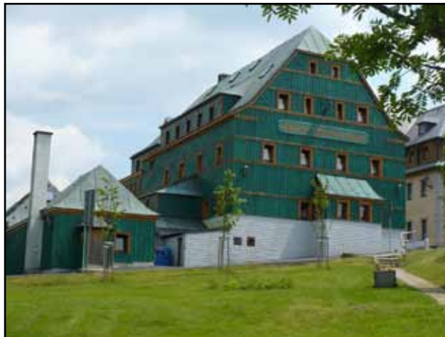
Hotel Zelený Dům. Podle pověsti v tomto hotelu posídal při cestě do Jáchymova v roce 1542 Martin Luther.

od roku 1897, vypravila během roku do Božího Daru kolem 7 tisíc zásilek. Vrcholu nechyběla ani meteorologická stanice. Horský hotel měl kapacitu zpočátku 40 lůžek, před 2. světovou válkou už více než 100. Tehdy se zde těšil zájmu skokanský můstek, sáňkařská dráha a samozřejmě sjezdovka. Dnes je na vrcholu moderní skiareál s novými dokonalými lanovkami a vleky, které určitě do Krušných hor přivedou další zájemce a budoucí obdivovatele. A s rekonstrukcí hotelu na Klínovci se počítá, takže se na jeho prokouknutí už těším.