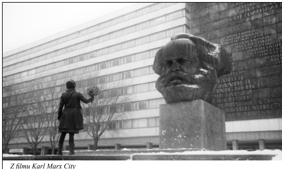
Z filmu Karl Marx City

Film Karl Marx City nám nechává nahlédnout právě do života v bývalé NDR. Můžeme se podívat na práci Stasi, vidět archivy východoněmecké tajné služby, která měla 92000 pracovníků a půl milionu spolupracovníků.