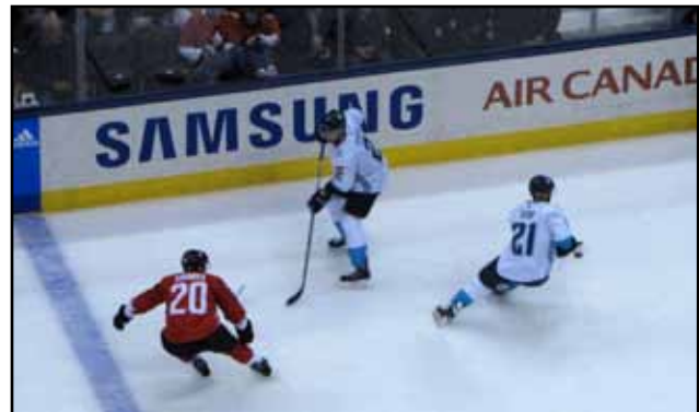
Sekera (2) a Tatar (21) v souboji s Tavaresem

Byli jsme rozhodnutí hodně forčekovat a to se nám vyplatilo. Když hrajete