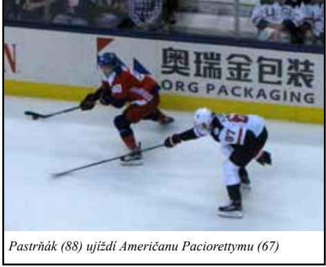
Pastrňák (88) ujíždí Američanu Paciorettymu (67)

Pro mne to byla velká zkušenost spolupracovat s nimi. Chtěl bych jim za to poděkovat. Připravovali jsme se opravdu poctivě na tento Světový pohár. Ostatní