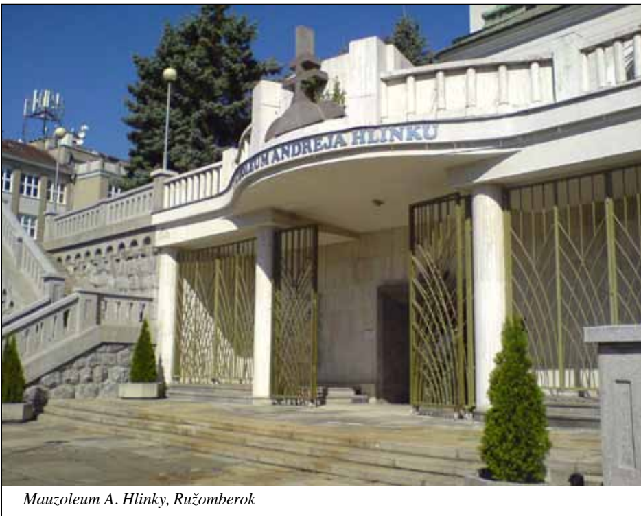
Mauzoleum A. Hlinky, Ružomberok