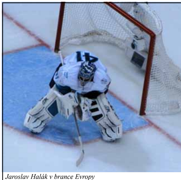
Jaroslav Halák v brance Evropy

Dnešní utkání bylo mnohem těžší než zápas proti USA. Dlouho Češi