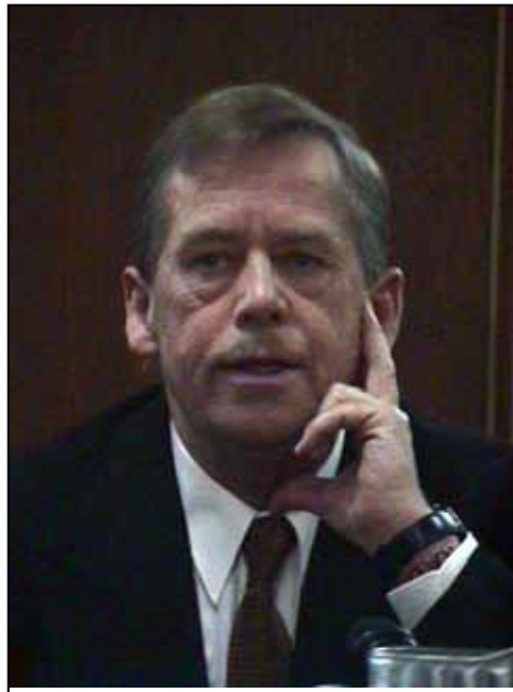
Václav Havel v Ottawě v roce 1999

19. února okolo 9. hodiny: Přilet do Toronta – uvítání Lincolnem Alexandrem.