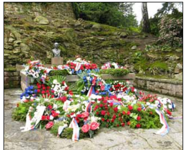
Hrobka dr. E. Beneše v Sezimově Ústí

Komunisté podvedli Hanu Benešovou, neboť její závět nerespektovali a při notářském řízení byl dědic přejmenován na „Čs. stát – Muzeum husitského revolučního hnutí v Táboře“ a o něco později byl podvod dovršen a za dědice byl označen „Čs. Stát – ONV v Táboře“. Do tábořského muzea se tehdy dostala jen část movitého majetku a do vily se prý nastěhoval Lubomír Štrougal. V roce 2000 se stala vila národní kulturní památkou i s celým areálem. V roce 2005 byl otevřen Památník dr. Edvarda Beneše a v roce 2006 se konečně zdařila další rekonstrukce, která přísně vycházela