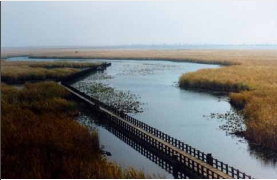
Point Pelee National Park

Každá z provincií i teritorií Kanady je rozdílná, má své zvláštnosti. Na západě to jsou hory a moře, uprostřed farmáři, střed jezera, východ šarm a drsná příroda. Na základě prostředí