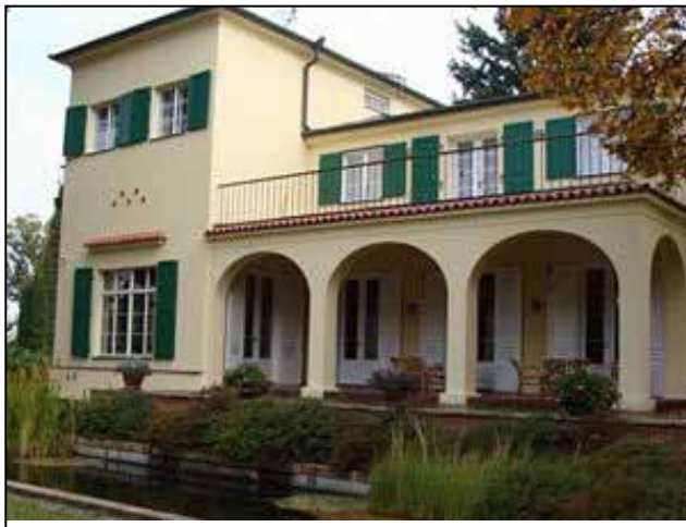
Benešova vila v Sezimově Ústí