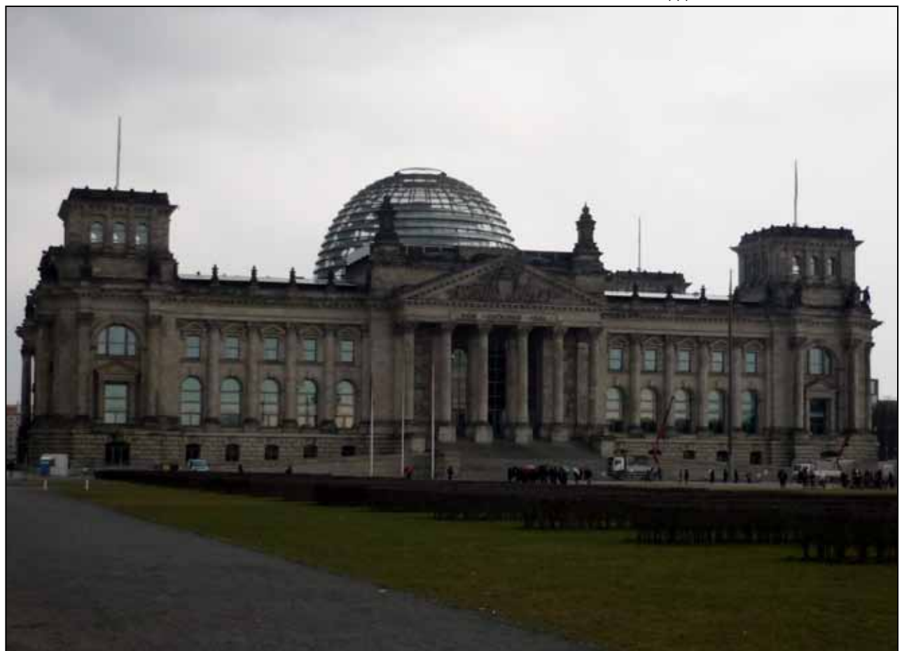
Oprava: V minulém čísle jsme v tištěném vydání obrázek kopule označili jako Říšský sněm , jedná se však o Berlínskou synagogu . V internetové verzi je popis obrázku správný. Dnes tedy přinášíme obrázek Říšského sněmu . Čtenářům i autorce se tímto omlouvám. Aleš Březina