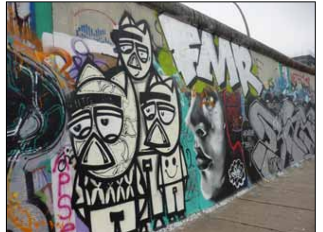
Dnešní Berlínská zeď

okupující jen malou plochu kolem řeky Sprévy (přitékající do Německa z Děčínska pozn. red.). Odtud se tradují i jeho počátky, z malé osady vyrostlo toto životem pulsující město. Koncem války byly sice všechny staré domy rozbity, i kostel Nikolaikirche , nejstarší v Berlíně, dostal přímý zásah a tak teď všechny budovy, kromě dvou, jsou jen replikami. Kostel byl také přistavěn, jeho základy pocházejí z raného 13. století. Malé uličky i romantická zákoutí přetrvávají. Toto je oblíbené vycházkové místo Berličanů. Za zmínku by určitě stála i moje návštěva Judisches museum , Židovského musea, ultra moderní stavba, byla jsem trochu rozpačitá,