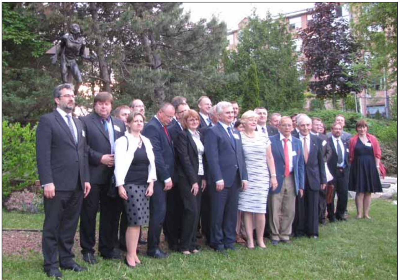
Delegace senátů a podnikatelů na Masaryktownu

Fajta za to, že mu umožnil instalace před Národní galerií ve Veletržním paláci; pozn. red.) Skutečně nevím, o takovém případě. Ale musím po pravdě říci, že při politickém styku s Čínou jsou více upřednostňovány ekonomické zájmy před lidsko-právními. Můj názor je, že Čína za posledních deset let udělala i v této oblasti pokrok. Současné čínské vedení nemůže zabránit tomu, aby se obyvatelé dostali na internet a věděli, jak funguje demokracie. Podle mne, i v Číně se bude soukolí diktatury pomalu zadržovat. Z pohledu Západu se to může jevit jako pomalé, ale po zkušenostech s arabským jarem je potřeba brát v úvahu, že by s čínským kolapsem mohl mít celý svět problémy. Věřím tomu, že Čína se bude pomalu přibližovat hodnotám, které my v euro-atlantickém seskupení považujeme za zásadní. Rychlejší vývoj by nemusel přinést příliš pozitivní výsledky. Skutečností je, že hodně politiků o lidských právech v Číně hovoří, ale ve skutečnosti upřednostňují ekonomické zájmy. Před časem jsem přijel do Číny a nestačil jsem se divit, kolik je tam německých investorů.