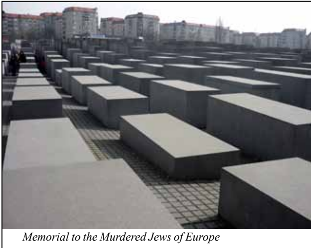
Memorial to the Murdered Jews of Europe

Velmi výjimečně působí Memorial to the Murdered Jews of Europe , zkráceně Holocaust Memorial - Memoriál věnovaný šesti miliónům zavražděných Židů nacisty v koncentračních táborech. Na ploše fotbalového stadionu v pravidelných řadách jsou položeny 2711