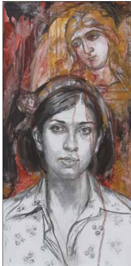
Nadžda Tolokonnikovová a anděl

polévány studenou vodou, dostávají špatné jídlo a nemají k dispozici základní hygienické potřeby. Následně kontroly ruské Federální vězeňské služby a prokuratury tyto informace v zásadě potvrdily. 1 V prosinci 2013 byly