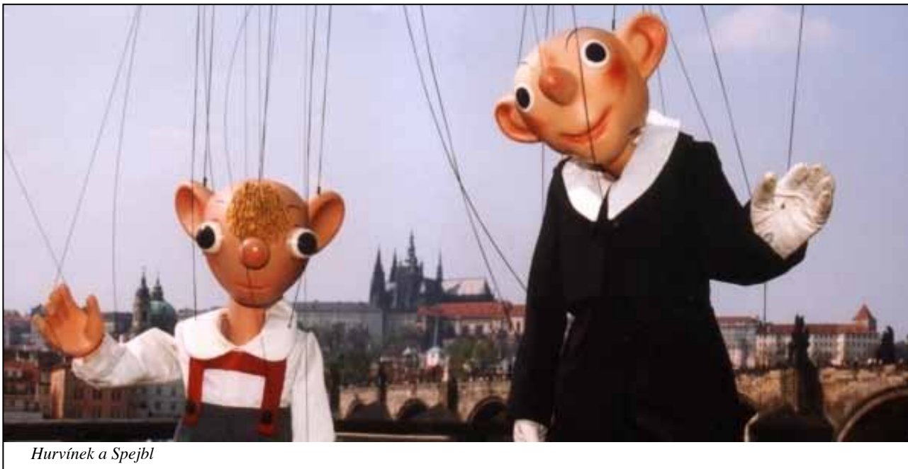
Hurvínka a Spejbl