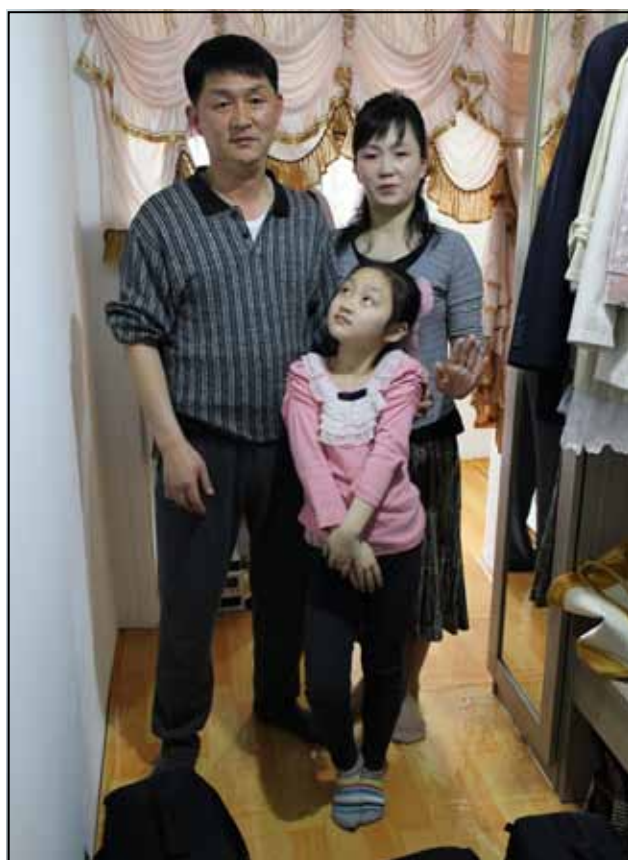
V paprscích slunce