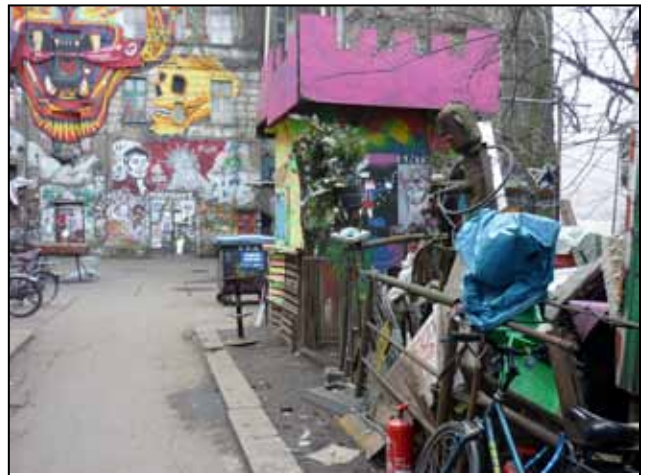
Pohled do východního Berlína

být a stále ještě je velmi silný rozdíl mezi bývalým východním a západním sektorem. Na první pohled poznáte, kde jste a to, prosím, po dvaceti pěti letech od sjednocení! Parky neupravené, lavičky napůl rozbité, chodníky nerovné. Paneláky, ala ruský vzor, pomalu ale jistě mizí z ulic a jsou nahrazovány velmi moderními a vkusnými bytovými celky. Nepoužívané staré tovární budovy se bourají a nová výstavba následuje. Toto je i sekce tzv. Alternative living - alternativního bydlení a to jsem tedy zírala! V bývalých rozlehlých továrních dvorech žijí squatters - nezákonný osadník, či samozvaný nájemník - staré nákladáky, auta, nábytek, všeho možného kolem, ploty porostlé křovím, brány s řetězy. Většinou rozbitá okna. Tak na výšku prvního patra, stěny budov pomalovány, nápisy Vstup zakázán! Jedna brána byla otevřená, nedalo mi to, vešla jsem na dvůr a vedle všeho toho, co už jsem napsala, tak jsem zde viděla skupinu asi osmi mužů sedět uprostřed dvora okolo ohně. Seděli dost daleko ode mne, jeden nikdy neví a tak trochu jsem se porozhlédla, vzala pár fotek objektu, pokynula na pozdrav. Stará garáž, vojenské auto, maringotky, všude se bydlí. Ale i tady bylo na všech stranách, kam oko dohlédlo, vidět graffiti po stěnách budov, i na částech zbouraných objektů. Kde leželo kus zdi, tam byla na ní i malůvka a většinou velmi zdařilé.