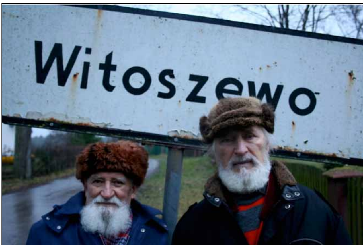
Z polského filmu Bratři

Druhým českým filmem a prvním z pěti, které jsem na festivalu Hot Docs viděla byla koprodukce Ruska, Česka, Německa a severní Koreje V paprscích slunce . Tento film byl rovněž uveden na plzeňském festivalu Finále a Satellite o něm psal v minulém čísle. I když jsou určitá fakta o severní Koreji známé, je tento dokument skutečně šokující. Přestože je udělán zvláštním způsobem je naprosto přesvědčivý. Což potvrdili nejen přítomní diváci, ale i pořadatel, který uváděl filmy. Jedná se o zvláštní spolupráci mezi filmaři a korejským policejním režimem. Přestože byl ruský režisér Vitalij Manskij pod neustálým dohledem, podařilo se mu zachytit syrovou skutečnost denního života v Pchjongjangu. Scény, které měly být dokumentem, jsou nainscenované, několikrát opakované. Takže je to skutečný smutný dokument, o tom