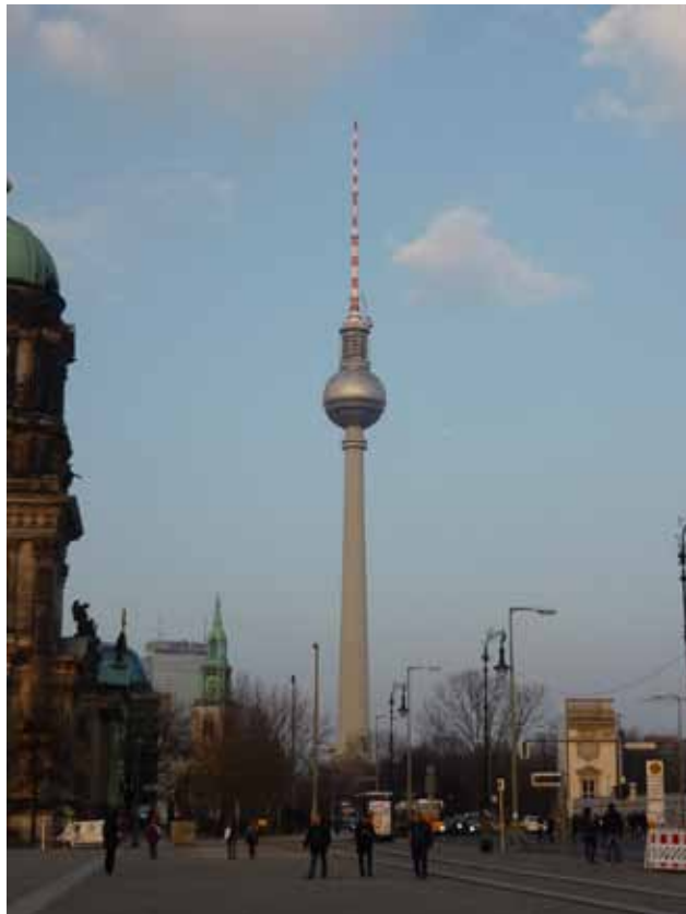
Berlínská televizní věž

Stručně z dějin města - Berlín leží na severovýchodě Německa, městem protéká řeka Spree – Spréva, vzdálenost Berlín – Praha je pouhých 350 km. Jeho první historicky doložené zmínění pochází z roku 1244, roku 1451 se stává vládním městem braniborských markrabích a kurfiřtů, 1701 pak hlavním městem Pruského království, 1871 hlavním městem nově založené Německé říše. Berlín byl v minulosti hodně tolerantním městem, kde nalezlo útočiště a nový domov mnoho pronásledovaných uprchlíků, mimo jiné po roce 1685 hugenoti z Francie – francouzští protestanti, později po roce 1730 i protestanti z Čech. Ve dvacátých letech 20. století se z Berlína stává evropská metropole s bohatým politickým, vědeckým a hlavně kulturním životem. Tolerance končí rokem 1933