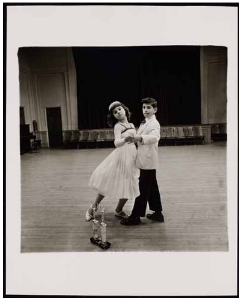
Diane Arbus: The Junior Interstate Ballroom Dance Champions, Yonkers, N.Y., 1962-1963. Gelatin silver print, 50.8 x 40.6 cm (sheet). Private collection, Toronto.