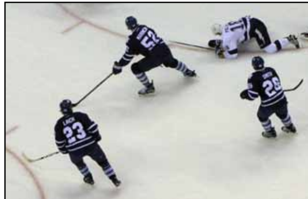
Ondřej Palát před druhým gólem Tampy

OP: Bylo to takové zvláštní utkání, protože Toronto mělo hodně hráčů z farmy. Očekávali jsme, že se budou snažit a že budou urputní. Toronto