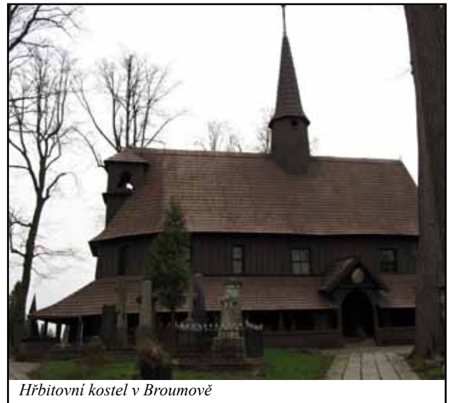
Hřbitovní kostel v Broumově

Dřevěné hrázděné konstrukce má našinec tak nějak spojené se stavbami v Německu, přitom se jim kdysi hojně přálo i u nás. A nebylo tomu jinak ani na Broumovsku, kde byl dostatek pevných a rovných kmenů ve smíšených lesích. A právě mezi hrázděné stavby lze zařadit unikátní stavbu výše zmíněného hřbitovního kostela. Kostelík je jednou z nejstarších staveb v celé střední Evropě váže se k němu i neobyčejná pohádka, že byl založen už 1177 pohanskou princeznou – o tom jak vypadal původně nic nevíme, později padl za oběť požáru při obléhání husity 1421 – víme, snad jen to, že byl ze dřeva. Dnešní podoba je asi z roku 1450. Je zasvěcen Panně Marii a je výjimečný nejen svým stářím, ale i konstrukcí u které nebyl použit jediný hřebík. Jak už jsem se zmínila, jde o stavbu hrázděnou a jen upřesňuji, že použité kmeny jsou dubové. Celá konstrukce kostelní lodi a kněžiště, stropů a krovů tvoří jeden celek, na kterém je umístěna vysoká zvonice – jedinečné mistrovské tesařské dílo. Kolem kostelíka je dřevěný ochoz, jehož výzdoba je úžasná. Jednak jsou v ochozu volně položené cenné náhrobky z minulých století. A jednak jsou zdi ochozu ozdobené devíti dřevěnými bíle natřenými deskami s černým německým písmem, přičemž sdělení provedená na deskách vytváří jakousi kroniku událostí města. Rok 1542 poukazuje na výskyt dravých kobylek, 1582, 1586, 1632 mor, 1847 cholera, ale i radostnější události jako 1766 klanění se budoucímu císaři Josefu II.