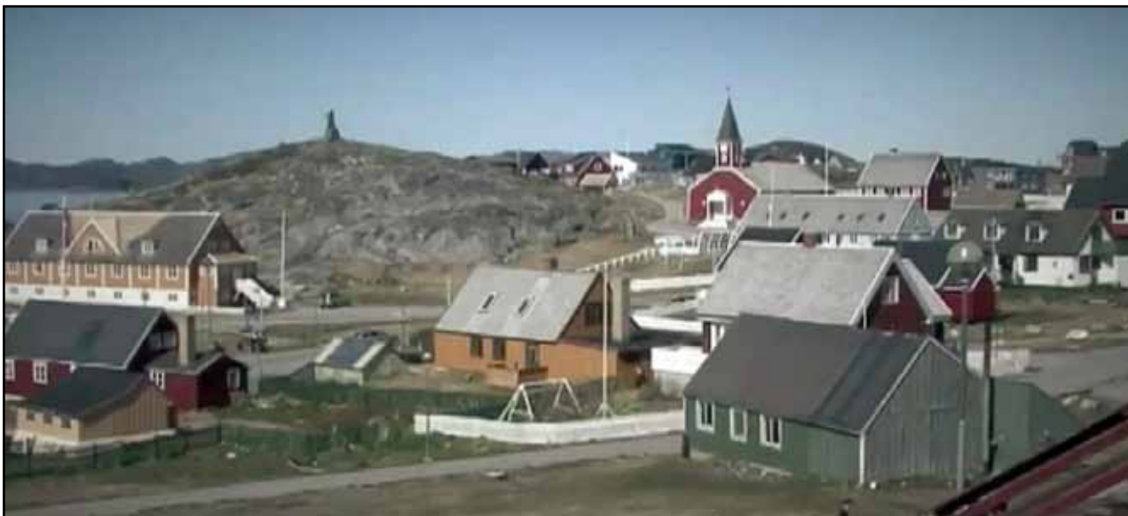
Moravští bratři na Labradoru