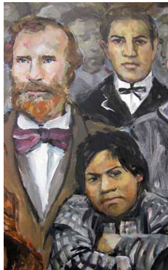
Obraz v muzeu ve Fort Langley (detail); 2014 - acrylic Kompozice Prohlášení Kolonie Britské Kolumbie v roce 1858