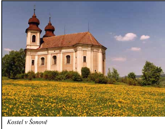
Kostel v Šonově

Je téměř neuvěřitelné, že vkročíte-li do docela malých vesnic jakými jsou zde Martínkovice, Božanov, Šonov, Heřmánkovice, Otovice, Vižnov, Vernéřovice, Bezděkov, Ruprechtice, čeká na vás barokní kostelní klenot. Opravdu v každé z uvedených vesnic. V první řadě se vás zmocní úžas při pohledu na barokní krásu venkovského kostela, pak přemýšlíte, či to asi byla odvážná myšlenka, že je sem nechal postavit a nakonec si s uspokojením řeknete, že sem do zdejší krajiny patří a že jim vůbec neublíží bezprostřední blízkost obilních polí, luk a lesíků a malé kopečky, na kterých většinou stojí přímo u vesnic, naopak, že česká sounáležitost překrásné venkovské krajiny a honosného baroka je viditelně na svém místě a v dokonalé harmonii.