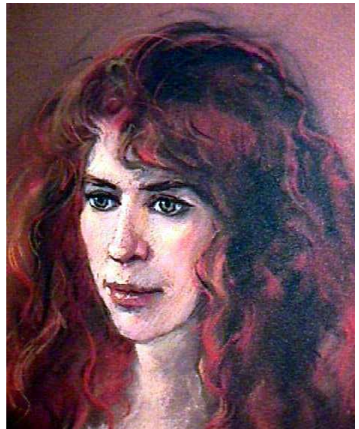
Děvče s červenými vlasy