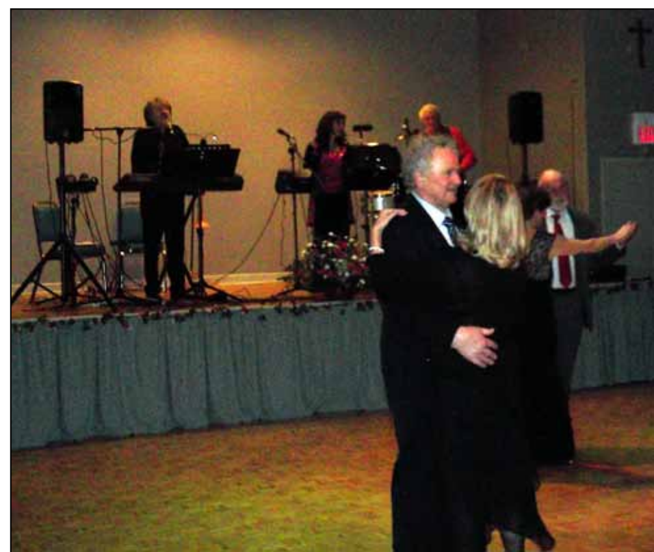
Z plesu farnosti svatého Václava