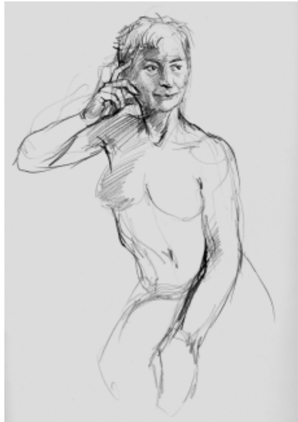
Kresba - Akt