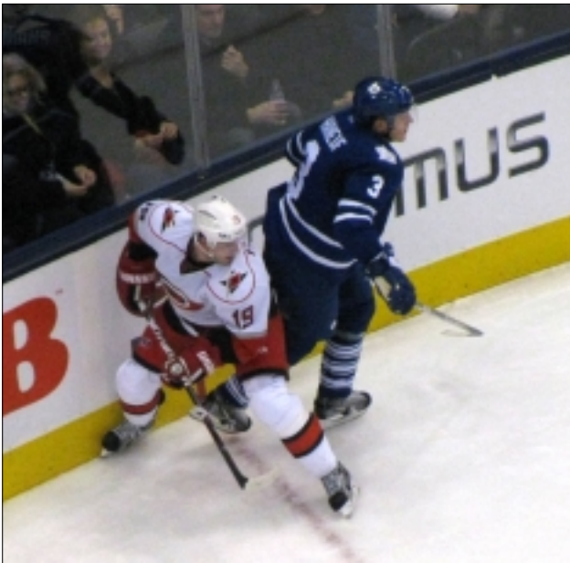
JIŘÍ TLUSTÝ A DION PHANEUF

JT: V druhé třetině Toronto dopravilo puk do sítě, ale branka nebyla uznána. Viděl jsem to jen na kostce a tak to nemohu posoudit, protože to byla dosti složitá situace pro rozhodčí. Byl tam určitý pohyb nohy, což bylo rozhodující.