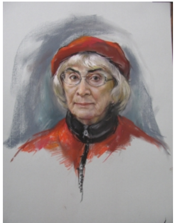
Mother - Pastel