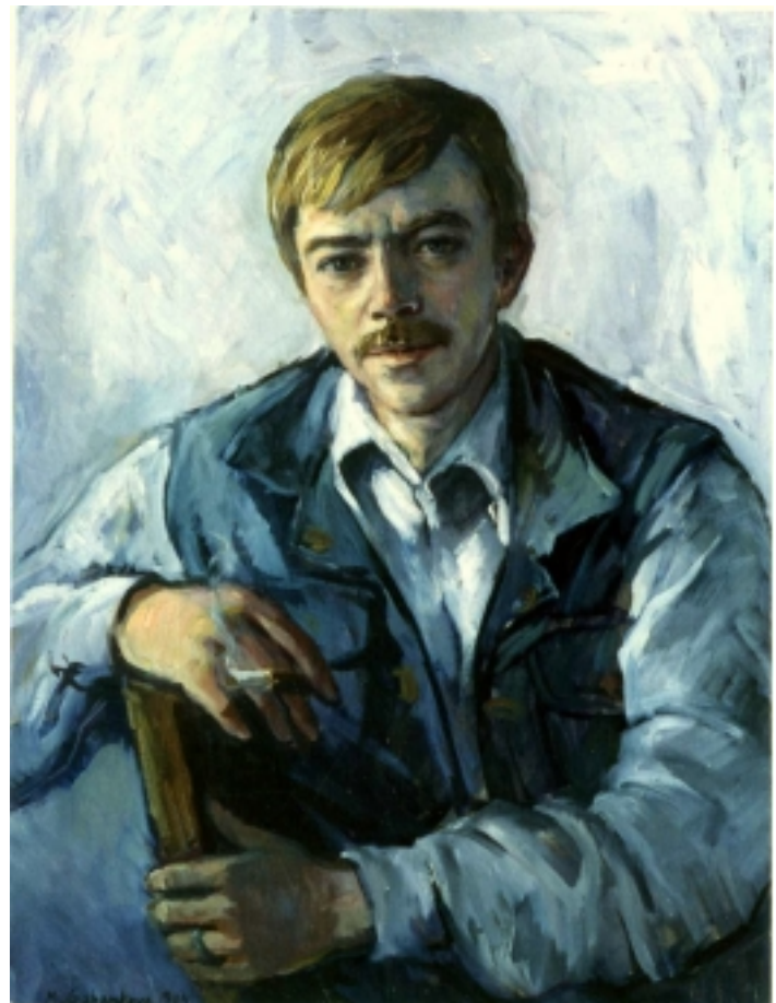
Portrét Karla Kryla