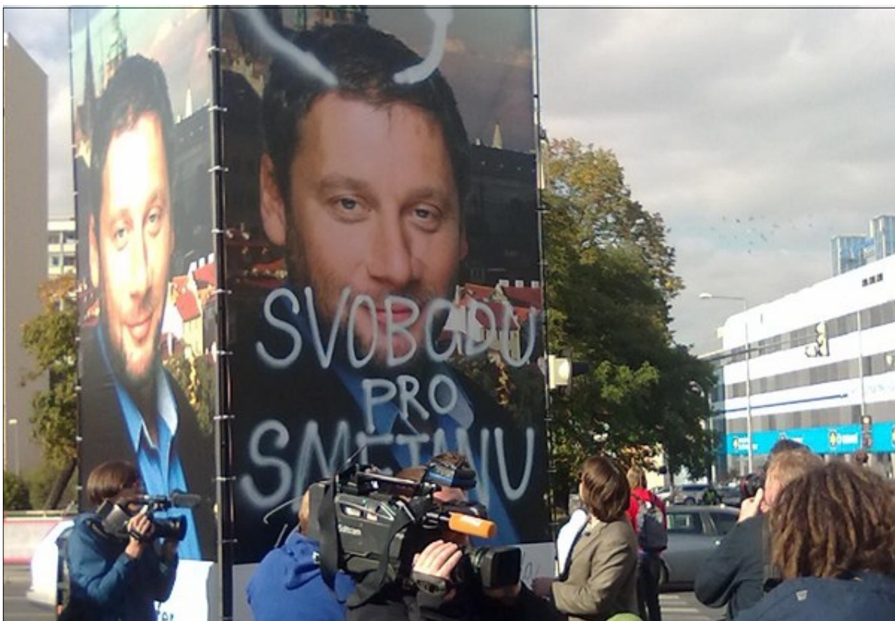
FILMAŘI VÍT KLUSÁK A FILIP REMUNDA PŘIDĚLALI ZA BÍLÉHO DNE KANDIDÁTU ODS TOMÁŠI TÖPFEROVI TYKADLA.

Přesto se prostředí v zemi měnilo. Lidé přestali mít strach. Jestliže Chartu 77 podepsalo maximálně 2000 lidí, pak manifest Několik vět v roce 1989 už třicet tisíc lidí. Došlo ke změně, která svrhla komunistický režim, což si připomeneme příští měsíc.