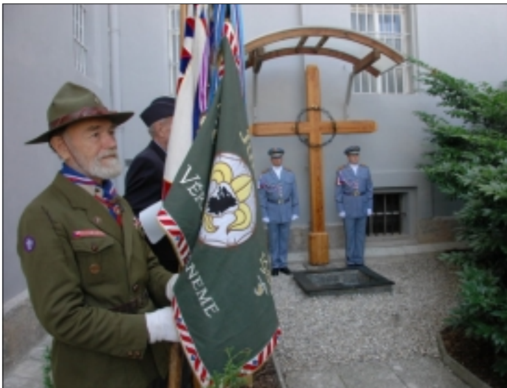
LETOS - V DEN VÝROČÍ POPRAVY MILADY HORÁKOVÉ

E-mail: czechevents.novotny@gmail.com www.czechevents.net