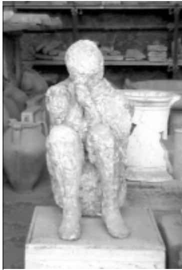
Zkamenělá sedící postava v Pompejích

Můžete zde navštívit dávné lázně s odděleným prostorem pro muže a ženy, s výklenky na odložení šatů a třemi bazény, tržiště a náměstí, které tehdy představovalo v Pompejích čtvrt těch nejbohatších, žijících ve vybraných palácích. Domy byly poschoďové, služebnictvo žilo v patrech horních. Z přízemí byly vstupy do zahrad a atrií. Jsou již k vidění i původní hlavní silnice, které byly už tehdy stavěny s neuvěřitelnou technickou promyšleností, schopné provozu koňských povozů. Kolem silnic jsou chodníky a na nich nízké patníky, které bývaly pokryté množstvím malíkových zrcátek, ve kterých se odrážel svit měsíce, a díky tomu bývaly chodníky v noci takto označeny a trochu i osvětleny. Je k vidění vodovodní systém s kašnami, kde kdysi tekla pramenitá voda. Na několika málo domech se zachovaly zbytky původních ozdob a na jiných jakási hesla k tehdy připravovaným volbám, urážky určené jednotlivým kandidátům a obscénní kresby. Největší a nejpodrobnější popis se v Pompejích věnoval existenci nevěstinců a připouštím, že to bylo hodně zajímavé. Je k prohlédnutí i obrovská palestra, což bylo místo sloužící ke sportovním hrám a také Teatro Grande pro pět tisíc diváků, včetně gladiátorských kasáren. Dokonalost tehdejších služeb je předváděna v domě s velkou prádelnou kde se pralo a čistilo prádlo za úplatu. A v dobrém stavu je také dům, patřící kdysi mastičkářce, čili něco jako dnešní lékárna a kosmetika dohromady.