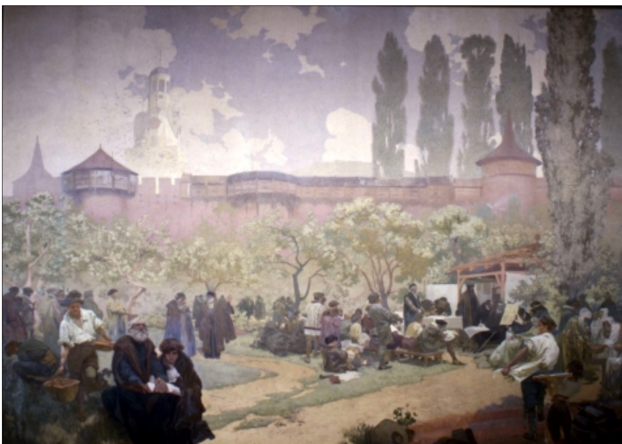
ALFONS MUCHA: BRATRSKÁ ŠKOLA V IVANČICÍCH

Je až překvapivé, jak je po sto letech od vzniku tohoto monumentálního díla Alfonse Muchy myšlenka panslavismu pro nás vzdálená. Kdyby nebyla pěkná brožurka vysvětlující vznik jednotlivých obrazů, asi bych nedokázal proniknout do jejich tajů. I přes detailní popis