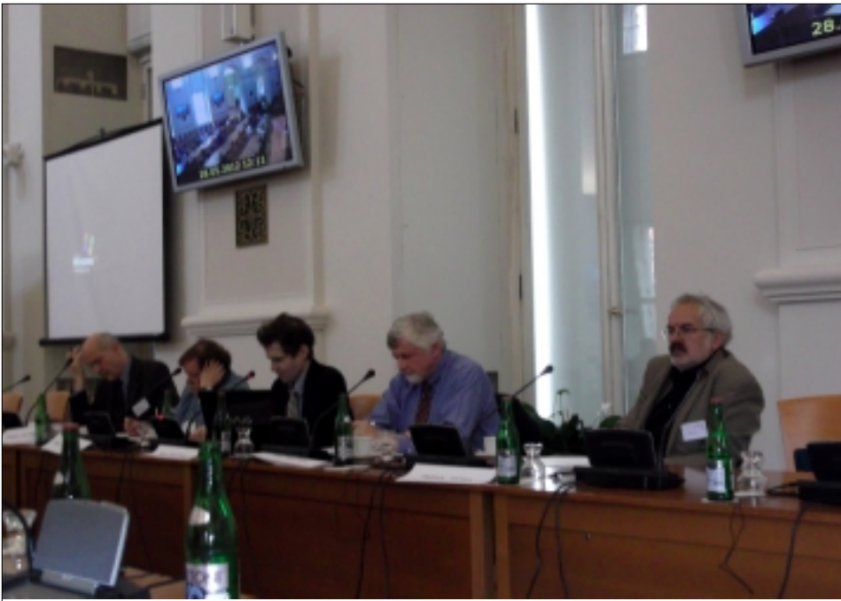
Z KONFERENCE K 100. NAROZENINÁM H. G. SKILLINGA