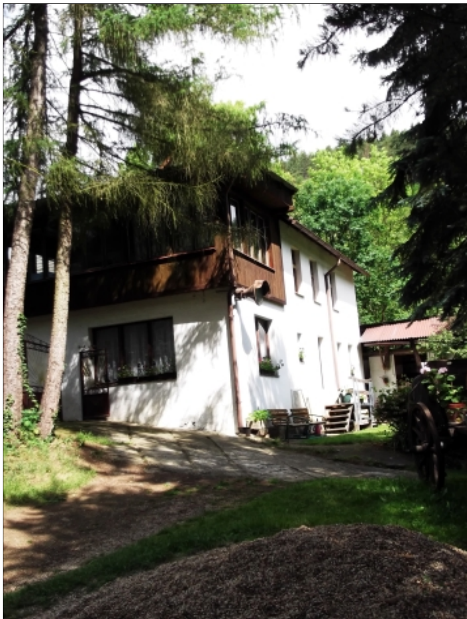
NA TOMTO MÍSTĚ SE I V DOBÁCH TOTALITY STŘETÁVALI NĚMCI Z NDR A SRN.

Německa, ale návštěvníci k němu jezdí stále. Nacházejí zde odpočinek i němečtí studenti, kteří žijí v Praze. Setkávají se zde i různé skupiny, které hledají klid. Jen tak jsem se pokusil spočítat, kolik je v jeho domě postelí; zastavil jsem se u čísla 40.