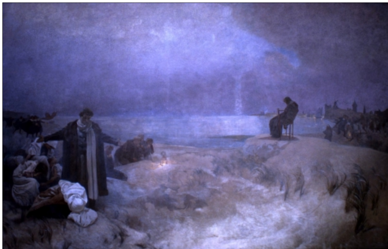
ALFONS MUCHA: JAN ÁMOS KOMENSKÝ

Slovanská epopej není jedinou výstavou, která stojí za pozornost. Na Pražském hradě jsou hned tři výstavy. Sbírkou obrazů z 19. století představují dvě expozice s názvem Poslední korunovaný český král Ferdinand V. Dobrotivý a umění jeho doby . Jedná se většinou o oleje z 18. a 19. století. Můžeme zde vidět obrazy rakouských malířů, ale i třeba Quido Mánesa. Ferdinand V. se narodil v roce 1793, byl synem Františka II., který se později označil jako František I. Českým králem se stal při korunovaci 7. září 1836 a na rakousko-uherském trůnu byl do bouřlivého roku 1848, kdy 2. prosince abdikoval. Zbytek života strávil v Praze, kde 29. června 1875 zemřel. Výstava je rozdělena do dvou částí. V Císařské konírně jsou obrazy, zatímco v Královském letohrádku je