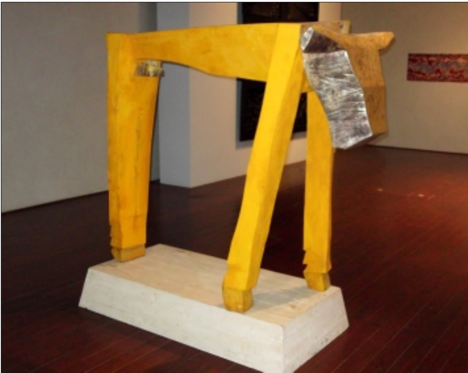
JAN KOBLASA: ZLATÉ TELE

V Jízdárně Pražského hradu je retrospektiva díla Jana Koblasy u příležitosti 80. narozenin. Věnuje se sochařství, malířství, kresbě, grafice, scénografii, kostýmnímu výtvarnictví filmovému i divadelnímu, literatuře i hudbě. Byl zakladatelem skupiny Šmidrové . V roce 1968 odešel do exilu a působil jako pedagog v Kielu až do roku 1998. Přes řadu exponátů, počínaje jeho realistickým obdobím až po jeho abstraktní