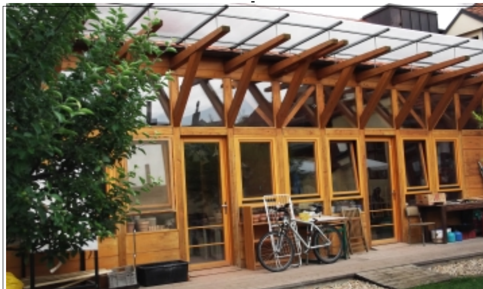
A TAKTO VYPADÁ ROLNIČKA Z VENKU