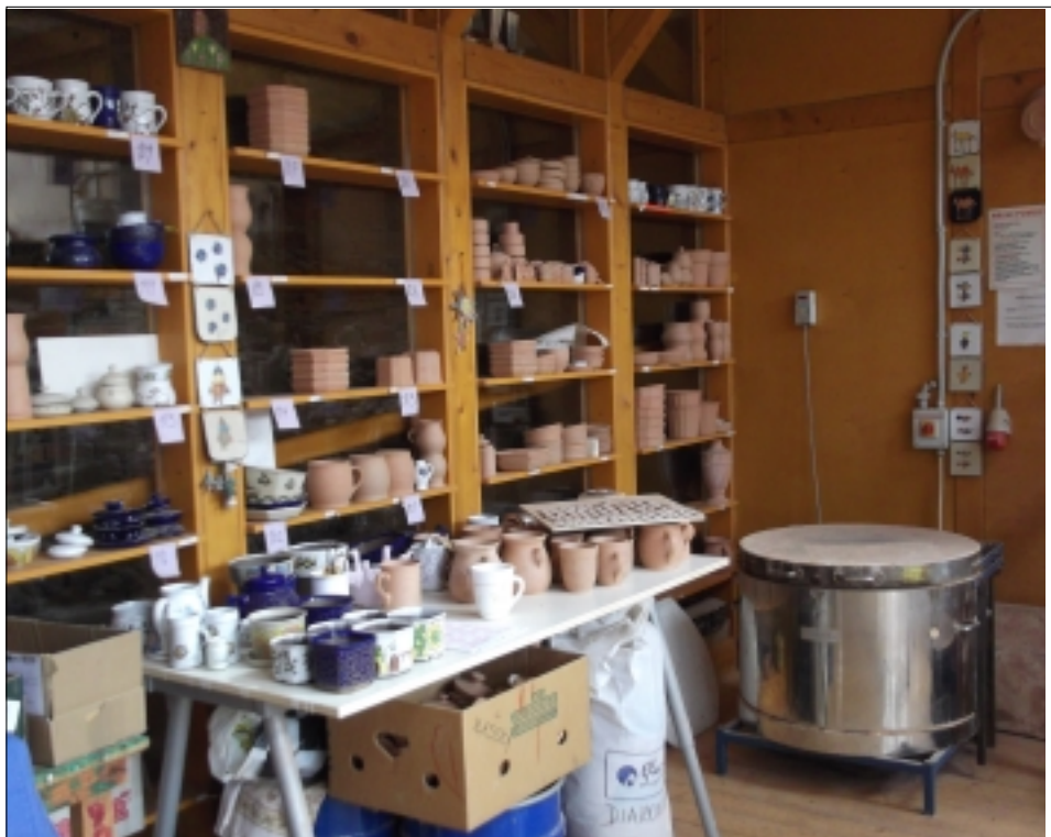
CHRÁNĚNÁ DÍLNA V SOBĚSLAVI