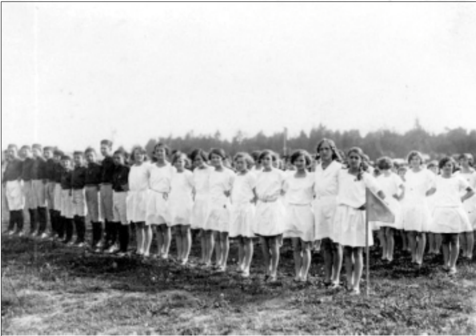
II. KRAJSKÝ SOKOLSKÝ SLET, ROK 1930, ŘAZENÍ PŘED PRŮVODEM.

Šedesátá léta 19. století přinesla v našem prostředí mimořádný rozvoj spolkové činnosti. Češi se postupně vzpamatovali z tuhého bachovského absolutismu, legislativa rakouské říše zahrnuje některé z požadavků liberálního hnutí roku 1848, konsolidovala se politická reprezentace. To vše vedlo k pozoruhodným změnám a uvolnění společenských poměrů. Na počátku 60. let kulminovalo tvůrčí úsilí májovců, představitelů nové vlny české literatury, roku 1861 začaly vycházet Národní listy , úplně nový typ politických novin vedených Juliem Grégrem, byla založena Měšťanská beseda , Prozatímní divadlo - a určitým vyvrcholením národnostních snah bylo položení základního kamene Národního divadla v roce 1868.