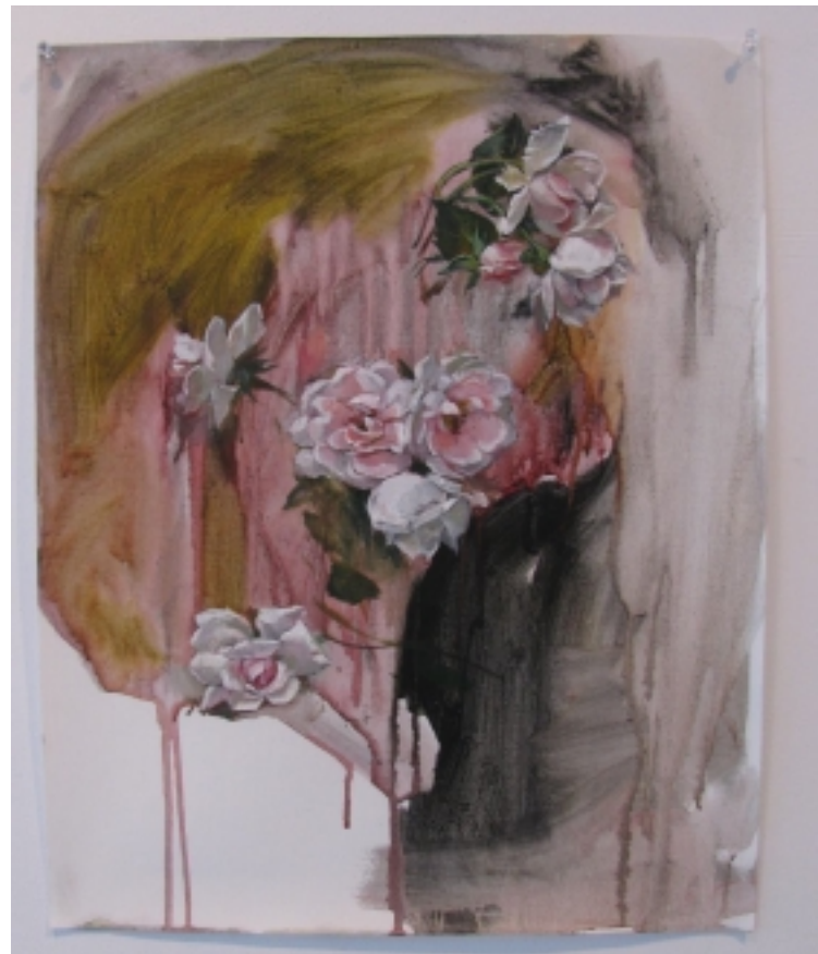
Flowers of Mystic Rebirth