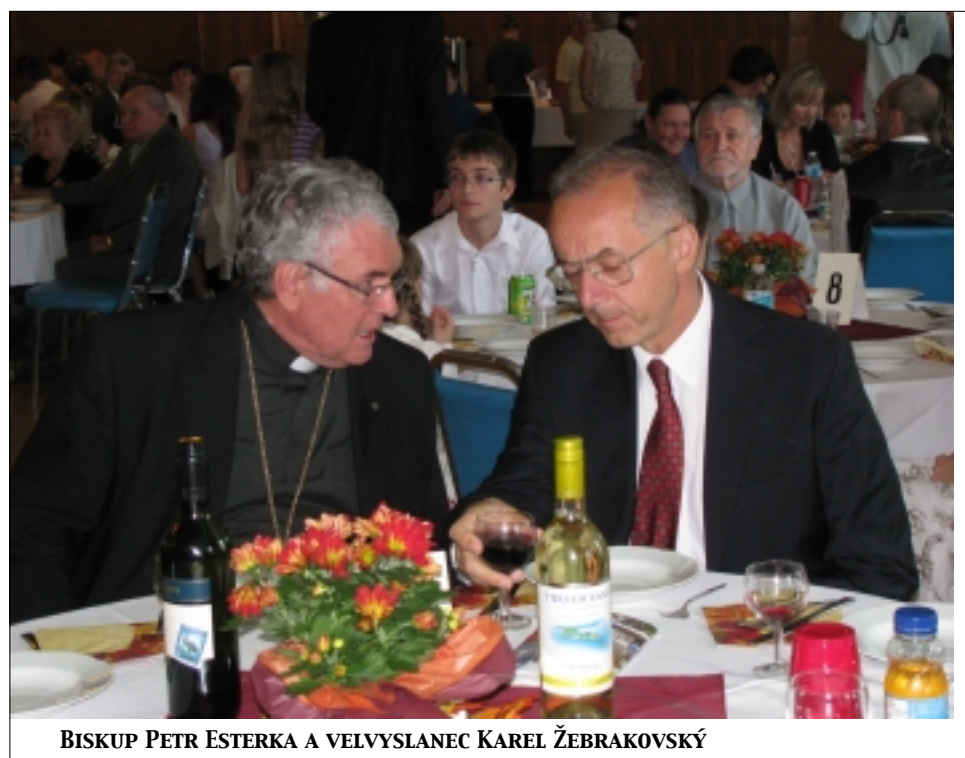
BISKUP PETR ESTERKA A VELVYSLANEC KAREL ŽEBRAKOVSKÝ