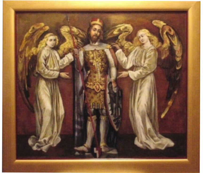
M. Gabánková: Svatý Václav v kostele na Gladstone Ave. (Podle sochy a obrazů v pražské svatovítské kapli)