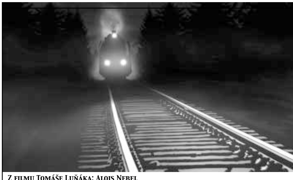
Z FILMU TOMÁŠE LUŇÁKA: ALOIS NEBEL