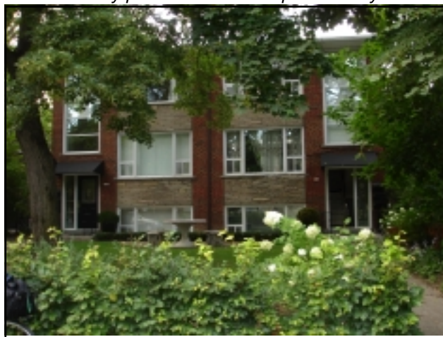
DNES STOJÍ NA 48 DEWSON ZCELA JINÝ DŮM