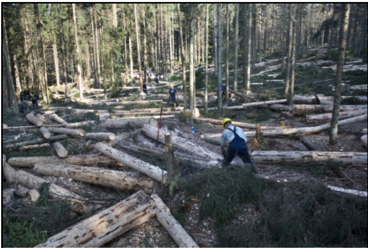
TO NEBYL URAGAN, ALE TUHLE SPOUŠŤ UDĚLALI LIDÉ NA ŠUMAVĚ

Vedení parku svůj krok u Ptačího potoka obhajuje i tím, že musí