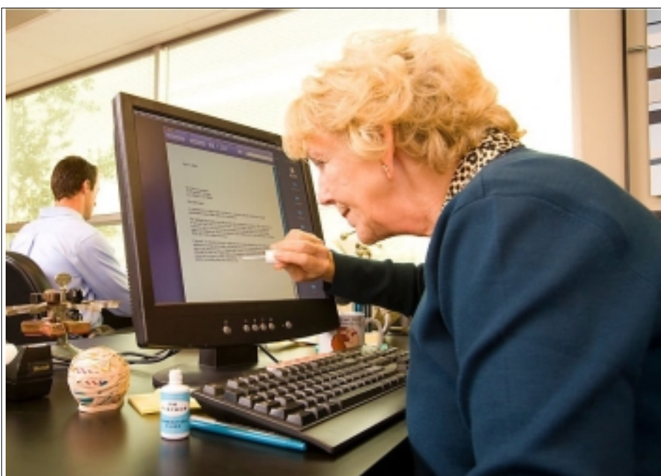
SENIOR U POČÍTAČE