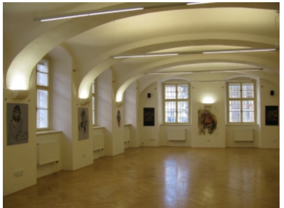
Z nedávné výstavy v Hradci Králové