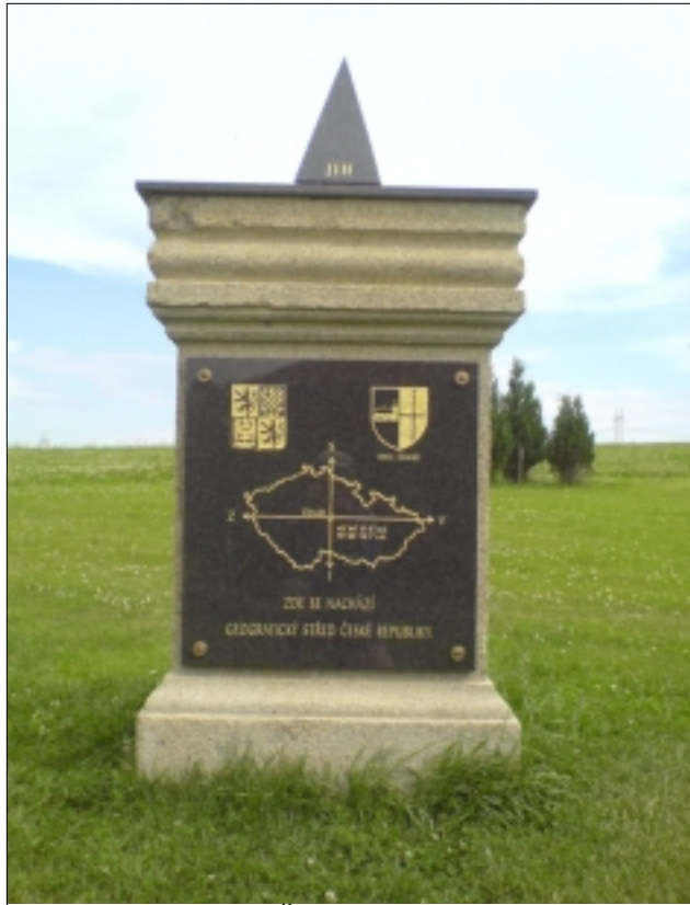
GEOMETRICKÝ STŘED ČR

Asi především lidové synonymum pro řádění víchru, krupobití, extrémní bouřku. Člověku orientujícího se v nedávné historii a pamětníku oněch časů připomenou se nejspíše takzvané čihošťské události v padesátých letech, běsnění zvlčilé komunistické moci. Katolík si jistě neodmítne unřesnění a dodá cosi o čihošťském zázraku