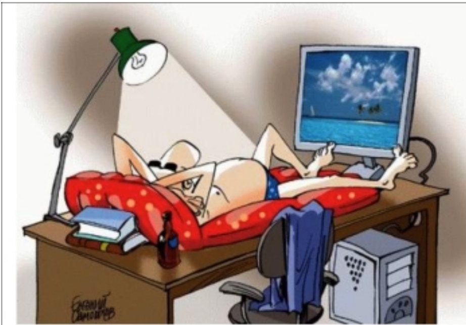
Letní dovolená pro podprůměrně placené kancelářské síly

Manželský pár, oba kolem 60 let, slaví své 35. výročí svatby v malebné tiché romantické restauraci. Náhle se na jejich stole objeví Drobounká, krásná víla a říká: „Protože jste byly takový vzorný manželský pár, protože jste celou dobu jeden druhého milovali, splním každému z vás jedno přání.“