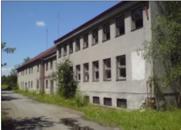
BÝVALÁ ROTA V CETVINĚ

Svatý Kámen v Novohradských horách při hranicích s Rakouskem je snad méně než osada. Kdysi podhorská ves s klášterem a řadou stavení, především však s široko daleko známým poutním kostelem a kapličkou se zázračnou vodou, čítá dnes tři trvale obydlené usedlosti. Z jedné z nich vám přijde otevřít kapli a kostel bývalý major PS. Krom toho vám nabídne ve stánku u kostela nejružnější svaté obrázky, přívěšky, růžence... Tehdejší místní rotu, zázemí pro sedmdesát peesáků, převzal Červený kříž. Její exvelitel vám naproti ní, coby rozený