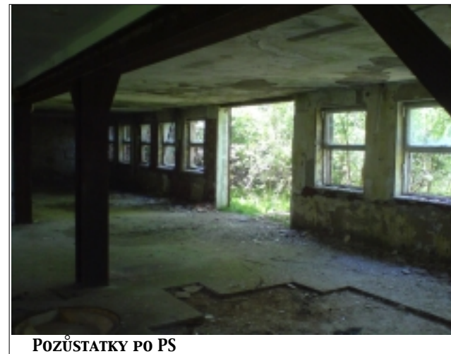
POZŮSTATKY PO PS

Avšak rozpuštěním této vojenské složky po sametové