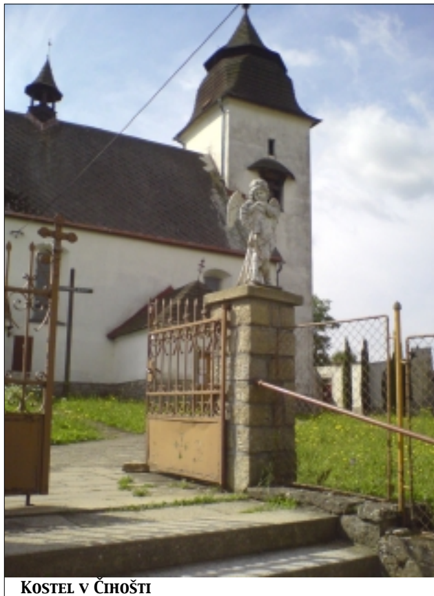
KOSTEL V ČIHOŠTI

Nejprve si připomeňme, co tomu všemu předcházelo. Klíčové datum je 11. prosinec 1949. Neděle adventní.