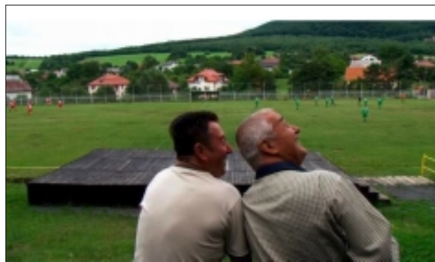
Z FILMU NESVATBOV

nefunguje. Nefunguje ani ekonomická stimulace, kdy nabízí za každé narozené dítě odměnu, ale starosta se nevzdává a pokračuje ve svých hlášeních a motivačních balíčcích. (Film poběží v Torontu v Innis Town Hall Theatre 3. května v 21:30 a 4. května v TIFF Bell Lightbox 4 ve 14:00). Film dostal na festivalu cenu Dagmar Táborské, která je dotována cenou 60 000 korun.