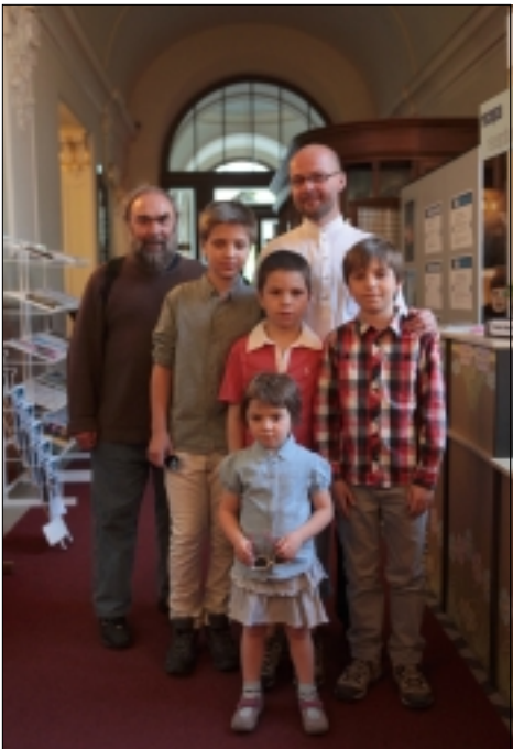
SETKÁNÍ BŘEZINŮ V PLZNI

být vylhané, ale pravdivá skutečnost nemusí být tak vzdálená od nepravdivé. Vina se nevypaří a jako u Dostojevského přichází trest. Nebudu spekulovat, o tom jestli je spravedlivý nebo krutý. To by bylo až na druhý díl filmu, ale pak by se z toho stal americký televizní seriál.