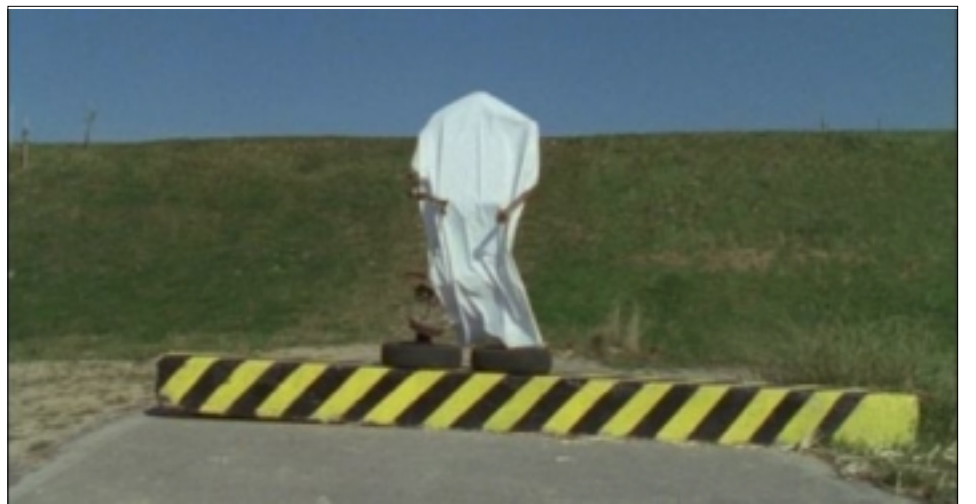
KONEC SILNICE A SOCHA STRAŠÁKA ZŮSTALY PO POLÍCH V NOŠOVIČÍCH

Zahájil jsem dokumentem, který získal cenu Dagmar Táborské Nesvatbov , cenu