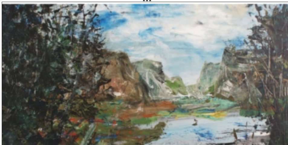
Standa Sedlák Od moře k moři Obrazy

3.5. - 22.5. 2011 Vernisáž 3.5. v 18 hodin Galerie Vyšehrad nad Libušinou tisků