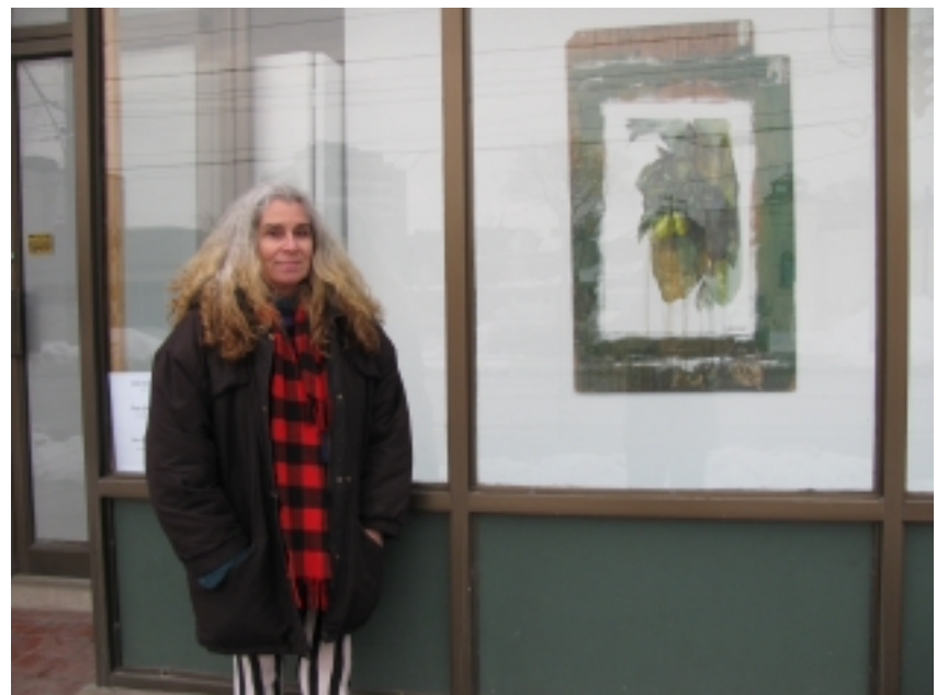
Malířka s obrazem

Howard Park Institute Window Gallery 2088 Dundas St. West, Toronto do 28.února 2011