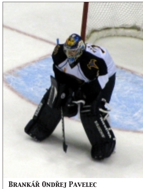
BRANKÁŘ ONDŘEJ PAVELEC