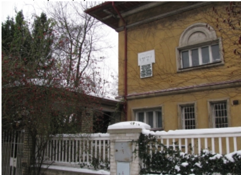
DŮM BRATŘÍ ČAPKŮ

Aleš Březina Oba už zase v Torontu ***—