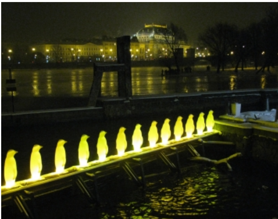
PRAŽTÍ TUČŇÁCI NA KAMPĚ