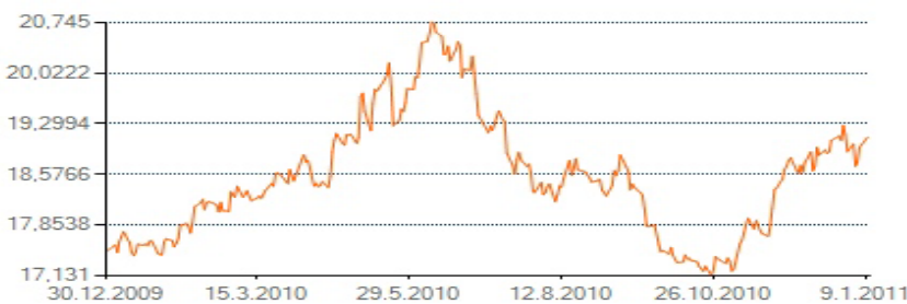
POHYB KANADSKÉHO DOLARU VŮČI KORUNĚ V ROCE 2010

www.brankovsky.com * e-mail: rostib@rogers.com