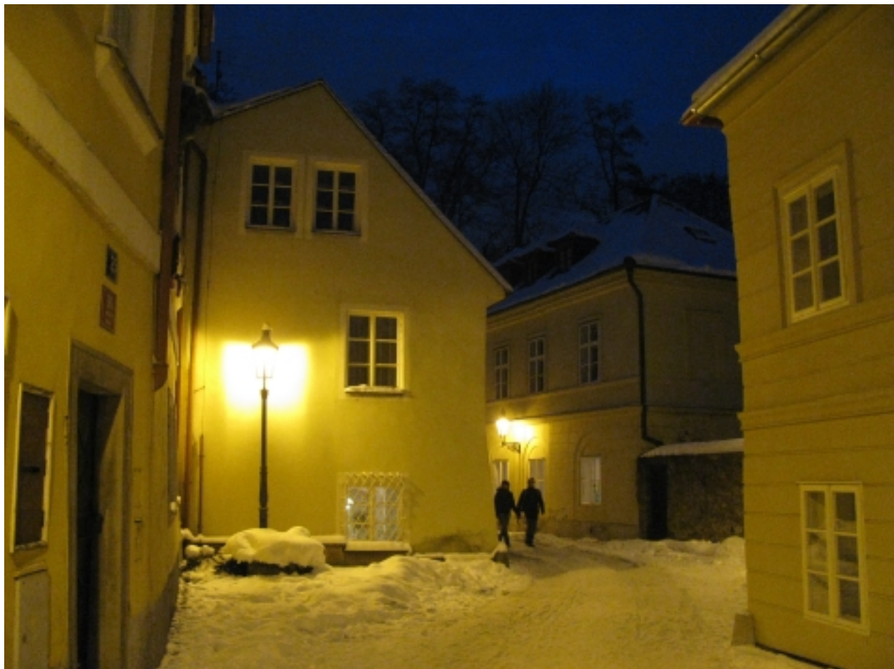
NOVOSVĚTSKÁ ZIMNÍ SYMFONIE

Zjistil jsem, že nejen cestování do Itálie má svoji poezii, ale i cestování z Itálie má své kouzlo. Při zpáteční cestě nám ve Florencii nejprve nechtěli vzít kufr, protože je příliš těžký. Přesunuli jsme tedy něco do lehčího kufru, který nedosahoval patřičné váhy. Když jsme si dali poslední cappuccino, tak přísná paní nám před vstupem nedovolila jít s příručním kufříkem do letadla, že je příliš těžký a že malířský stojan by mohl být zbrání. Nechali jsme tedy zabalit malířský stojan s