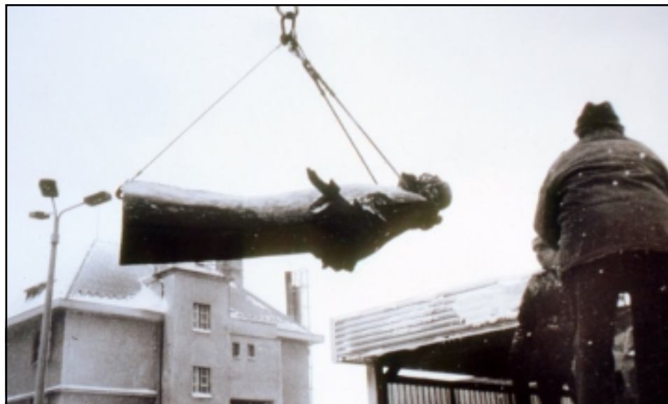
INSTALOVÁNÍ SOCHY J. A. KOMENSKÉHO V BERLÍNĚ