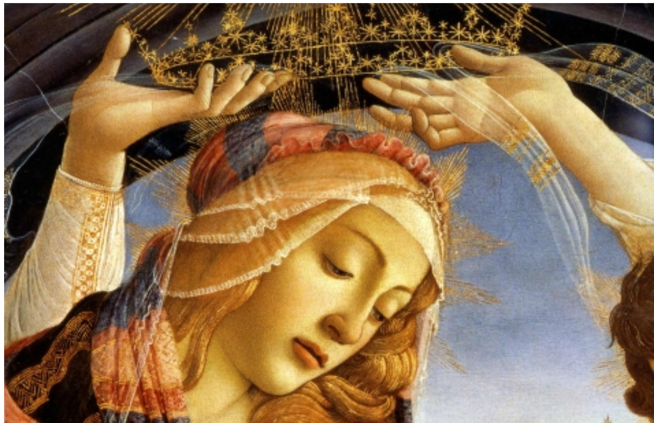
SANDRO BOTTICELLI: MADONA