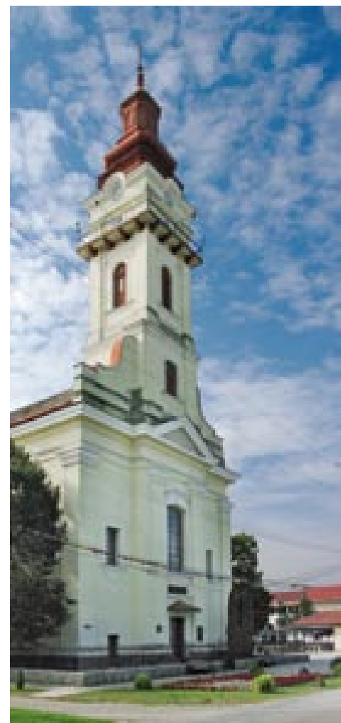
Slovenský evanjelický kostol v Nadlaku má najvyššiu vežu spomedzi evanjelických kostolov na Dolnej zemi.