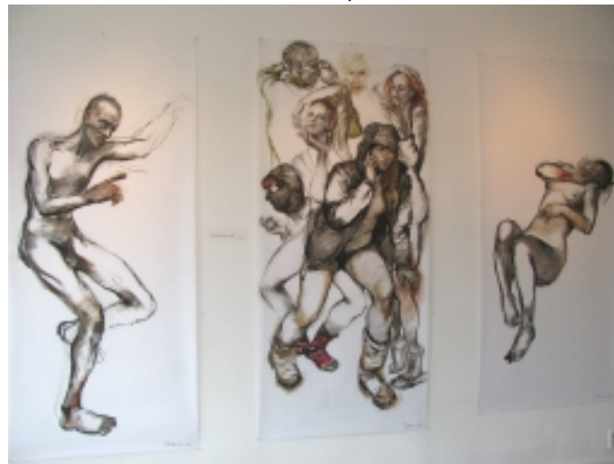
Z výstavy Puzzle