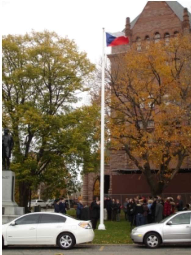
ČESKOSLOVENSKÁ A ČESKÁ VLAJKA PŘED BUDOVOU ONTARIJSKÉHO PARLAMENTU

to (a to je zvědavost, již ve mně pět páně náměstkových slov vyvolalo), co jeho otec a jiní levicoví intelektuálové cítili (a jak reagovali), když jejich režim soudil Miladu Horákovou a ulicemi táhly zástupy jejich soudruhů (hlavně soudružek) zuřivě vymáhajících smrt jedné z největších žen českých dějin. A snažím se pochopit, jak lidé narození ve stejném