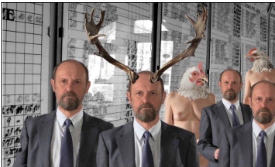
Z FILMU J. ŠVANKMAJERA: PŘEŽÍT SVŮJ ŽIVOT

Je to stará otázka. Zda cestou k umění může být šílenství? Lépe řečeno zda nás obraz nejrůznějších psychologických sklonů a handicapů člověka může přiblížit estetickému či filozofickému pohledu na jeho život. Vedle všech psychoanalytických drsnářů a mytologií podvědomí nabídl kdysi Švankmajer svou českou a originální odpověď. Převlekl tajnosti našeho psychického života do groteskní hry animovaného i naivistického divadla, jež přitom imaginativně zrcadlilo nejrůznější slepé mechanismy lidské psychiky.