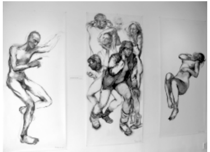
Triptych: Spící vidí