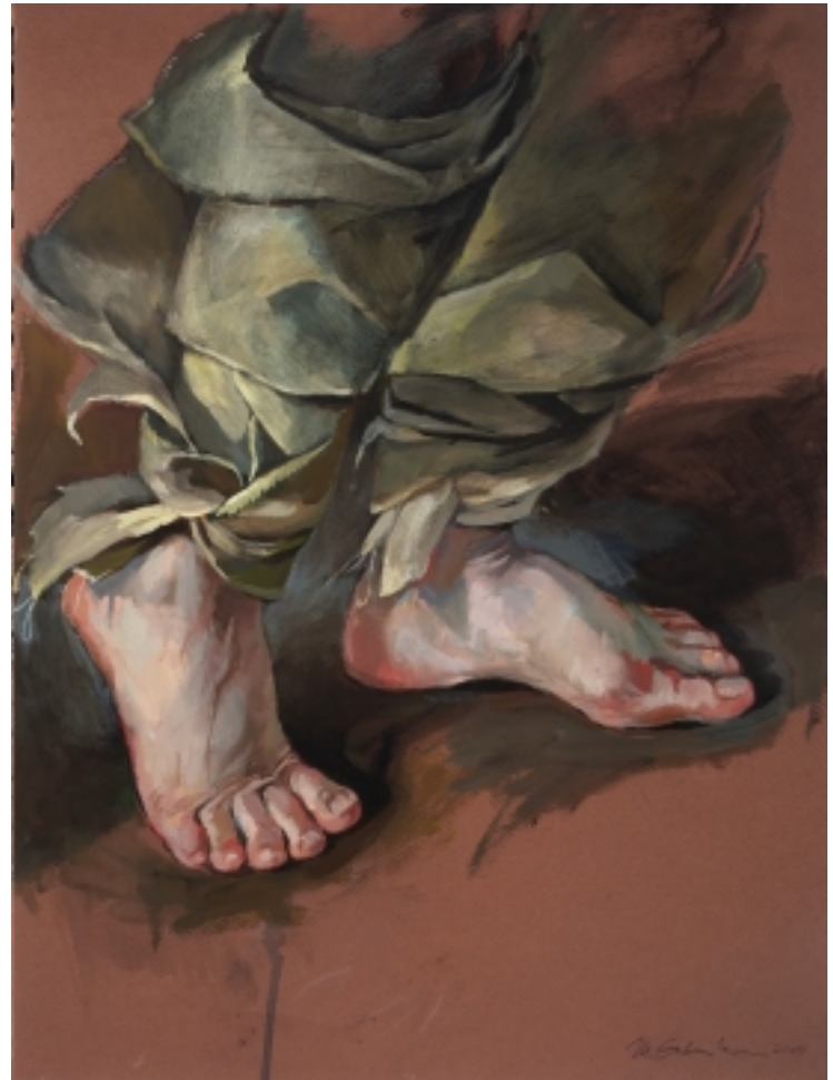
Nohy - Dobrá zpráva