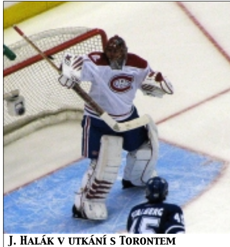
J. HALÁK V UTKÁNÍ S TORONTEM

JH: Zatím tam ještě nejsme, pouze o to bojujeme, abychom se tam dostali. Každý hráč udělá všechno pro postup. Máme ještě deset zápasů do konce, ale věřím tomu, že se tam dostaneme.