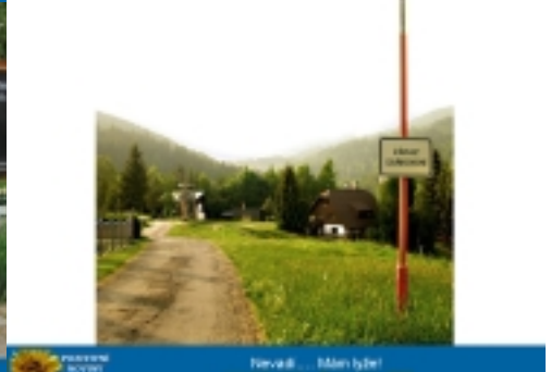
Třebaž ... Mám lyže!