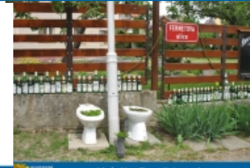
Jak pěstují svině, pomůže i navarek.