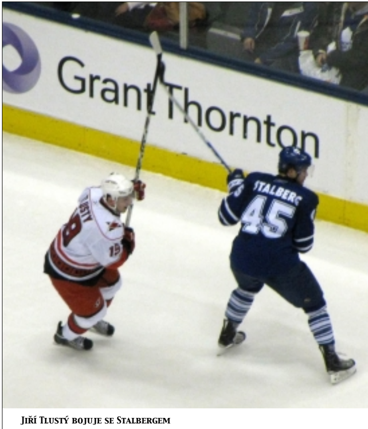
JIŘÍ TLUSTÝ BOJUJE SE STALBERGEM