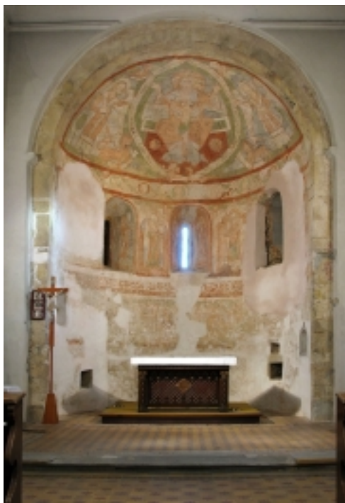
CELKOVÝ POHLED DO KOSTELA

Neméně zajímavou skutečností bylo odkrytí fragmentu mladší vrstvy (kolem roku 1500) s klečící postavou starce. Tato plocha byla restaurátorem sňata technikou transferu a posléze bude možné její uplatnění v jiných prostorách.