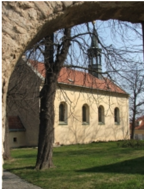
KOSTEL STĚTÍ SV. JANA KŘTITELE V HOSTIVAŘI

Zázraky se dějí. Mimořádný unikát, rozsáhlou nástěnnou malbu z konce 13. století, našli památkáři v pražském kostele Stětí sv. Jana Křtitele v Hostivaři. Restaurátoři dokončili první etapu záchranných prací. Odborníci se shodují, že v nenápadném kostele se jedná o objev středoevropského formátu. Stará nástěnná malba, která pokrývá celou konchu apsidy, rozsahem a kvalitou nemá v České republice obdoby.