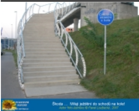
Štola ... Můj zblblení do schodů na kole!