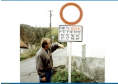
Já se z toho plánu ... Už mi zase stojí!