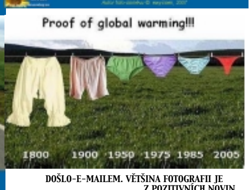
DOŠLO-E-MAILEM. VĚTŠINA FOTOGRAFIÍ JE Z POZITIVNÍCH NOVIN