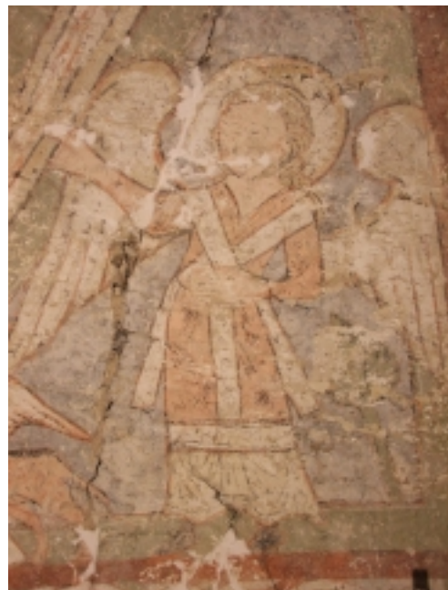
ANDĚL PO LEVICI KRISTA

kostel obnoven. Jednou z podmínek, které si stanovili, byl restaurátorský průzkum apsidy kostela. Výsledkem bylo objevení fresky v květnu 2007, místy až pod dvaceti nátěry a zásluhou profesionální práce restaurátora, akad. malíře Miroslava Slavíka.