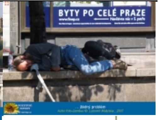
... žádný problém