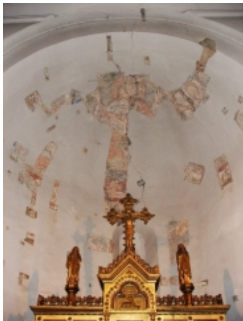
DRUHÁ FÁZE ODKRÝVÁNÍ FRESKY Z ROKU 2006