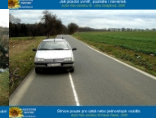
Silnice posaz pro šaká nebo jináčostapá vialita.