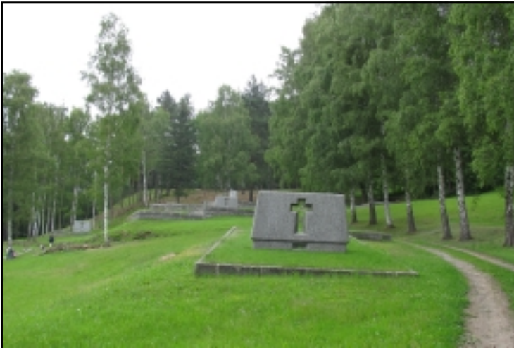
LEŽÁKY: PO VYPÁLENÝCH DOMECH ZŮSTALY JEN ZÁKLADY