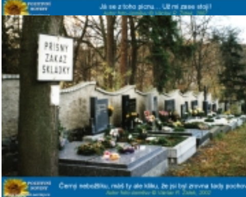
Černý neobdělá, raději ly ale klá, že jo! In' zrovna taky probovát!