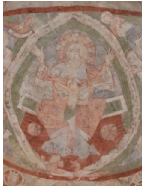
BŮH OTEC A KRISTUS

V dubnu 2009 byla, pod záštitou kardinála Miloslava Vlk a senátora Jana Nádvorníka, vyhlášena veřejná sbírka za účelem zachrany pozdně přemyslovských fresek. Ze stejného důvodu uspořádala kronikářka na radnici Městské části Praha 15, kam Hostivař patří, výstavu fotografií o průběhu odhalování fresek a Základní umělecká škola Hostivař benefiční koncert. V současné době je na účtu, díky lidem dobré vůle, na sto tisíc korun.