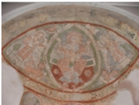
POHLED NA STŘED NÁSTĚNNÉ MALBY