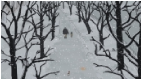
MŮJ PES TULPÁN