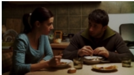
PRIDÁVNÉ JMÉNO: POLICEJNÍ

Moskvě kvartet Benny Goodmana a natočil zde legendární desku Benny Goodman in Moscow , takže něco se zde o Charlie Parkerovi vědět muselo. Jestli to bylo z pašovaných gramofonových desek nebo z cizího rozhlasu, je otázkou, ale pochybuji o tom, že by to bylo na lpčkáčích, jak nám to chce namluvit film. Možná, kdyby byl posazen do zmíněného roku 1965 v době Chruščovovy perestrojky a odhalení kultu osobnosti, tak by to bylo věrohodnější. Film však v žádném případě věrohodný být nechce. Jedná se o muzikál a jako kdyby tato hudba z té doby chýběla a Todorovskij se snažil tuto mezeru po půl století vyplnit.