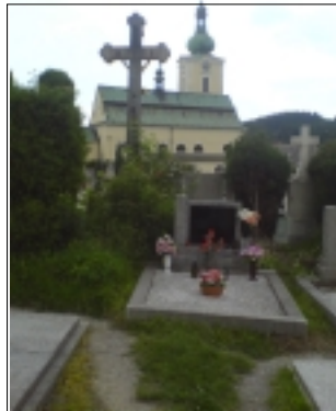
KATOLICKÝ HŘBITOV V JIMRAMOVĚ

střípky. Ale i z toho, o čem zde vypovídají kamenní pamětníci starých časů lze ledacos odvodit.