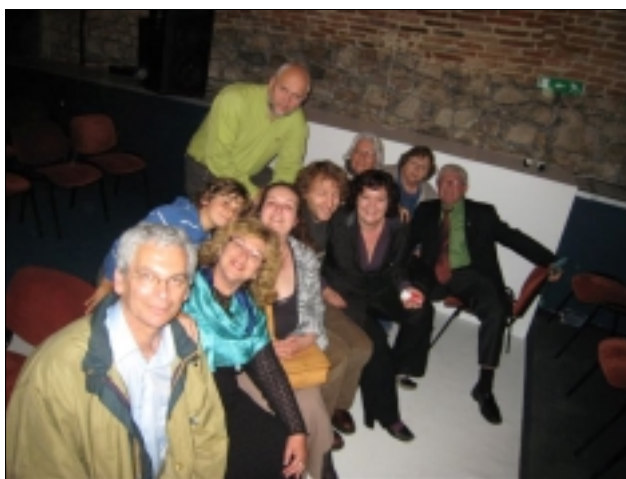
ZE ZÁJEZDU NA SLOVENSKO

Neobyčajne milo a profesionálne sa správal aj technický personál všetkých divadiel. Úplne chýbala tá povestná