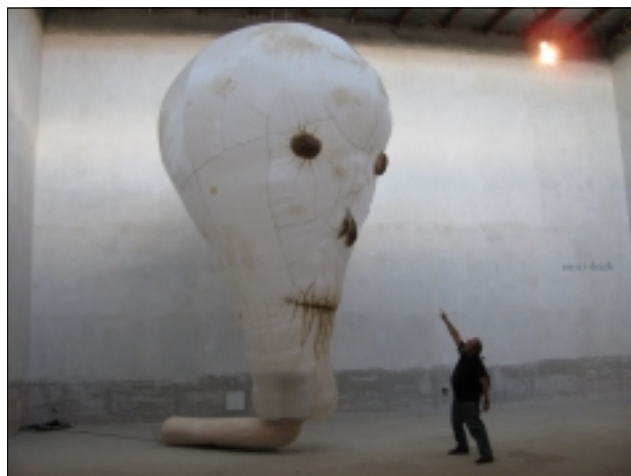
GALERIE DOX: KDYŽ VSTOUPÍTE DO MÍSTNOSTI, VYBAFNE NA VÁS SMRT

Veletržní palác má zase pro změnu výstavu českého moderního umění, kde