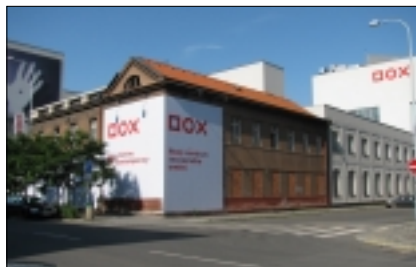
NOVÉ CENTRUM SOUČASNÉHO UMĚNÍ DOX V PRAZE