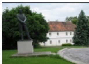
SOCHA ANTONÍNA DVOŘÁKA A JEHO RODNÝ DŮM V NELAHOZEVSI

Jestliže zámek Hluboká je památkou na dobu Schwarzenbergů, pak další zámek poblíž Prahy v Nelahozevsi je náhledem do šlechtického interiéru rodiny Lobkoviců. Navíc je toto místo rodištěm nejslavnějšího českého hudebního skladatele Antonína Dvořáka.