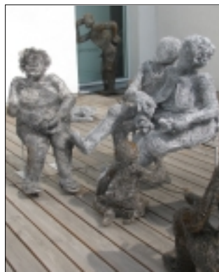
Z RESTAURACE GALERIE DOX