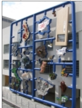
DAVID ČERNÝ - ENTROPA

fotografují. Mne více zajímalo dešifrovat jednotlivé země. Přiznám se, mnohdy se mi to nepodařilo. Není to však jediná