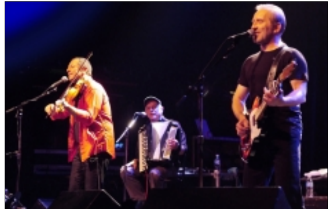
ČECHOMOR V TORONTU

O existenci tohoto hudebního souboru jsem se dozvěděl (ach, ignorantství stáří) před nepříliš dlouhou dobou. V posledních měsících - díky plánům generálního konzula ČR v Torontu, Richarda Krpače a celého konzulátu (české Toronto má štěstí, že na konzulátu pracuje tak talentovaná a milá skupina lidí), a zvláště pro