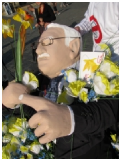
FIGURÍNA VÁCLAVA KLAUSE NA HRADĚ PŘI OSLAVÁCH JHO NAROZENÍ

Prezident Václav Klaus svými antikologickými aktivitami a zahleděním sám do své vlastní moudrosti se stal terčem, do kterého se strefuje svými šípy humor prostého lidu. Již v 15. století Jeroným Pražský pořádal happeningy, při kterých si dělal legraci z mocných, včetně Václava IV. Ani jeho jmenovec Václav Klaus