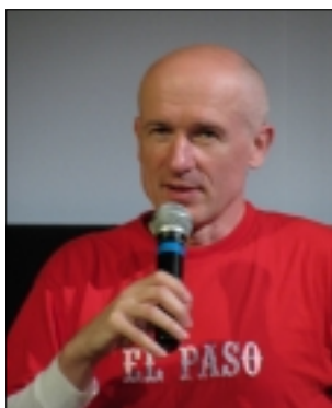
REŽISÉR ZDENĚK TYČ

kteřá má nikoliv sedm, ale dokonce devět dětí a že jí hrozí jejich odebrání a ona se nechce těch dětí vzdát. Tak jsem se začal zajímat o to, jestli ji už někdo zastupuje. Dověděl jsem se, že je již právníčka, která ji zdarma hájí. Na tu jsem získal po čase kontakt a požádal jsem ji o spojení s touto ženou, která bydlí v Českých Budějovicích a která už byla vystěhovávána na ubytovnu. Začátek byl poněkud rozpačitý, protože ona už měla špatné zkušenosti s lidmi kolem, a byla k nim trochu ostřejší. I k lidem, kteří měli zájem o tento případ. Když mi otevřela dveře, tak jsem se představil a řekl jsem jí, že znám její případ, jestli by dokázala něco o sobě říci, protože by z toho mohl být film. Ona chvíli zvažovala, jestli se se mnou bude bavit nebo ne. Pak jsem tam jezdil stále častěji a líbil se mi její postoj. Zajímavá byla změna, že se musela zabývat novou skutečností,