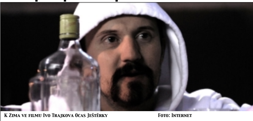
K ZIMA VE FILMU IVO TRAJKOVA OCAS JEŠTĚŘKY

Pochopitelně neviděl jsem všechny filmy na plzeňském festivalu, ale jediný film, který se v otázce života a smrti, absurdity našeho života tomuto filmu přiblížil byl film Ivo Trajkova Ocas ještěřky . Trajkov, který přednáší na pražské FAMU, natočil v roce 2004 vynikající film Velká voda . V roce 2007 šokoval tím, že udělal 8 mm celovečerní film Movie . Již v tomto filmu zpracoval anděla, jako někoho, kdo nemluví, ale kdo ovládá nás