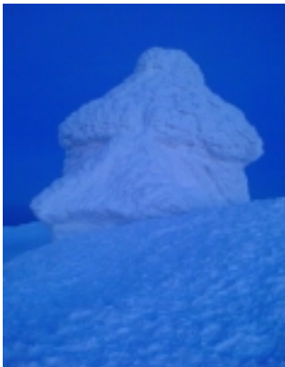
KAPLE SV. VAVŘINCE

České lidstvo na Sněžce tedy zastupuje pouze a jen poštovník. Ve svém vrcholovém poustevnickém příbytku