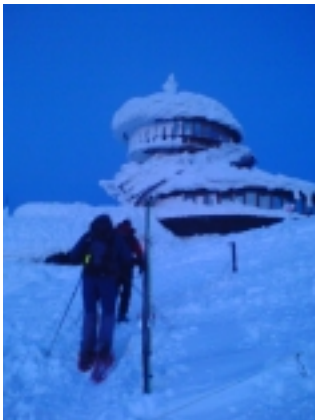
KRAKONOŠ SE NEDÁVNO ROZHODL ZLIKVIDOVAT POLSKOU OBSERVÁTOR

Je březen, poutní kaple svatého Vavřince zůstává zakleta ve sněhovém krutyní. Právě takový před pár dny strhl část vnějšího pláště sousední polské observatoře. Je březen, pod horami u potoků rozkvétají koberec bleblů a sněženek, tady vládne ledovým železem vosatý Duch hor. Tvář zvrásněná starostmi o své těžce zkoušené hory, nervózně bařá z neodmyslitelně