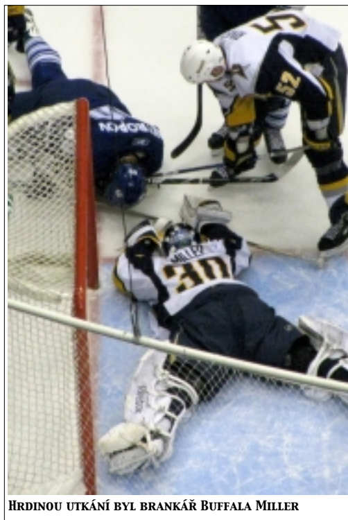
HRDINOU UTKÁNÍ BYL BRANKÁŘ BUFFALA MILLER

ABE: Odešel jste jako mladý hráč ze Slovenska. Nyní mají mladí hokejisté svůj tým, který působí v extralize. Co soudíte o tomto experimentu?