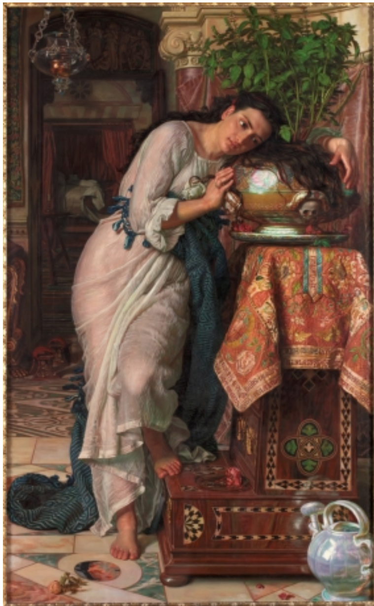
William Holman Hunt (1827-1910), Isabella and the Pot of Basil , 1866-8, retouched 1886, oil on canvas, 187 x 116.5 cm. Laing Art Gallery, Tyne and Wear Museums

Od 14. února do 10. května 2009 je v nově otevřené Art Gallery of Ontario výstava anglického malíře Williama Holmana Hunta a několika jeho současníků, kteří se vrátili v polovině 19. století do předrafaelitského období. Kromě figurální a religiozní tvorby můžeme vidět i krajiny z oblasti Palestiny, kde Hunt delší dobu pobýval. Podle jeho obrazu Krista je například i vitráž v Unitařském kostele na St. Clair, kde jsou pořádány koncerty Mozartovy společnosti. Hunt se narodil v roce 1827 v Londýně, byl dvakrát ženat. Od roku 1844 navštěvoval královskou akademii, kde potkal Johna Everetta Millaise a Dante Gabriela Rossetiho. V roce 1853 prošel náboženskou zkušeností, která poznamenala jeho tvorbu na celý život. Na výstavě je přes šedesát obrazů, můžeme zde vidět i jeho biblické ilustrace. Výstava je organizována ve spolupráci s Manchester Art Gallery, svá díla zapůjčily i Tate Britain , the Birmingham Museums and Art Gallery , National Gallery of Canada , the Cleveland Museum of Art a the Minneapolis Institute of Art .