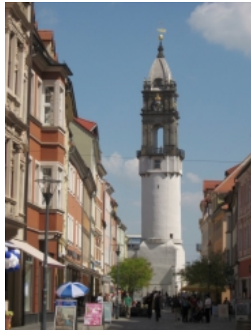
Budyšín, Bohatá věž, stavba z r. 1490, nejmějš hned po věži v Pise

- dostalo přijetí téměř královského. Zastavili jsme se na chvíli v předsíni, a najednou se otevrou dveře a milá žena v kroji nás vřele vítá, jako by čekala jen a jen na