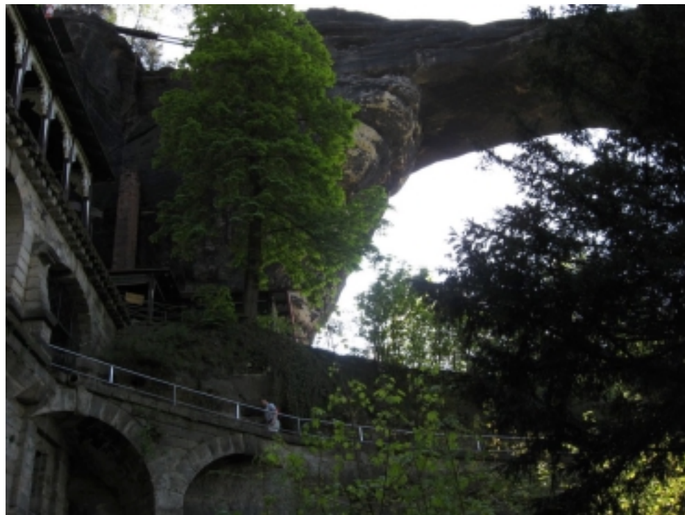
Pravčická brána - Oblouk 25 m dlouhý a 21 m široký

nás. A jaká je místní kuchyně? Je podobná české a německé. Například hovězí s křenovou omáčkou je jako od maminky. O tom, že pohostinství zde drží krok s módou, svědčí přidání orestované zeleniny. To by si měly osvojit mnohé české restaurace. Poněkud nezvyklý pokrm je však salát s uzeným kaprem. Ten má podobu úzkých proužků, které vypadají jako šunka. Vánočního kapříka pokrm nijak nepřipomíná.