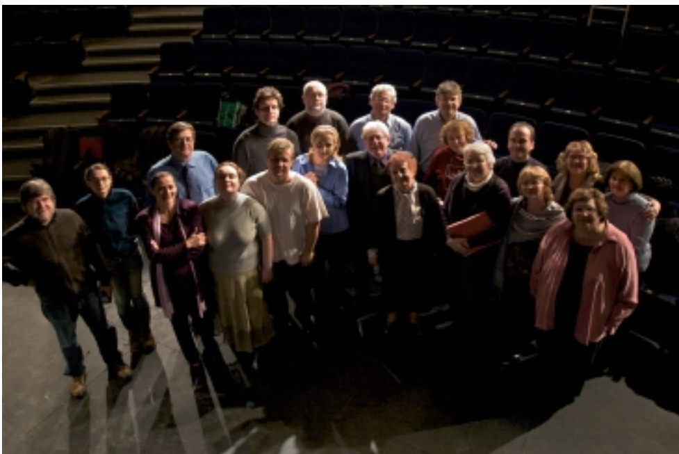
AKTÉRI HRY HORÚCE LÉTO 68