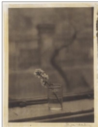
J. SUDEK: KVĚTINA V OKNĚ MÉHO STUDIA