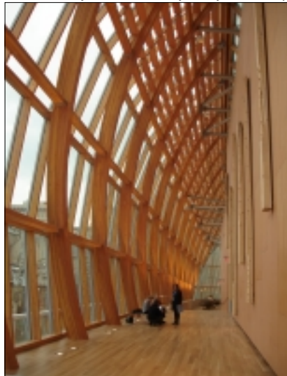
SEVERNÍ STĚNA AGO - ZE VNITŘÍ

Půl hodiny před koncem zápasu se objevil první nespokojenec, pesimista, či nepřítel, který opouštěl stadion a mířil na tramvaj. Když byl stav nepřítel, dav opouštěl stadion i pět minut před koncem, pak visely na tramvajových tyčích a ve Vršovicích se objevovala čísla tramvajů, která jsme tam nikdy