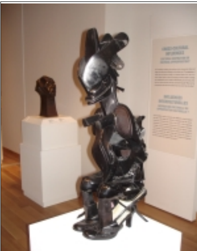
W. COLE: MATKA A DÍTĚ SOCHA Z DÁMSKÉ OBUVI

jindy nespátí. To se během let nějak vytratilo. Stadion zpustnul. Hrál se na Strahově. Zdálo se, že je ta slavnostní atmosféra nenávratně pryč.