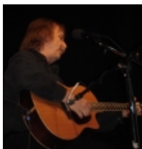
J. NOHAVICA V TORONTU

Jarek Nohavica je pokračovatelem slezské poezie. Zpívá jak v slezském nářečí, tak v polštině, češtině i slovenštině. Je svůj. Co se mně na něm nelíbilo, když se stavěl do pozice bojovníka za svobodu. Jeho politická prohlášení mně někdy připadala laciná a neměl to zapotřebí. To tentokrát