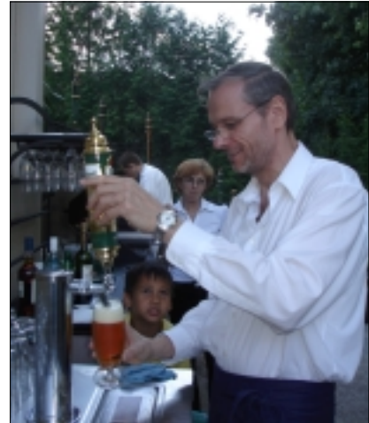
DNE 21. SRPNA 2008 PŘIJDE DO VYBRANÝCH RESTAURACÍ V ONTARIU TOČENÝ PLZEŇSKÝ PRAZDROJ!