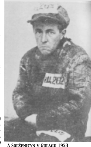
A SOLŽENICYN V GULAGU 1953

Jestli si toho někdo všimnul nevím, nikdo se po knížce nesháněl, ale měl jsem dobrý pocit z toho upozornění, že člověk má hlídat dobré věci v každém dni.