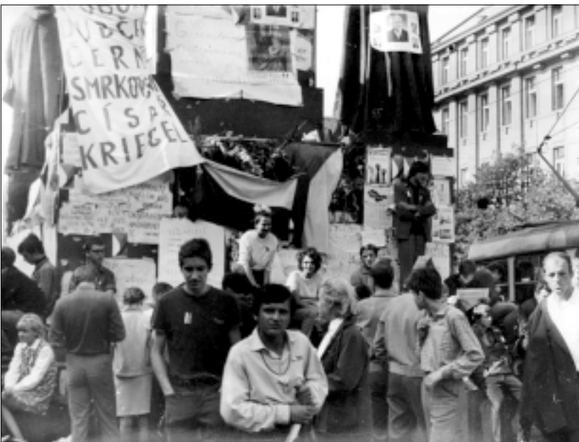
SRPEN 1968 VE FILMOVÉM TÝDENÍKU

Sešli jsme dolů. Přednosta odložil telefon. V Pardubicích se prý o nás Rusové dověděli a poslali za námi tři obrněné vozy. Poděkovali jsme mu a kameru